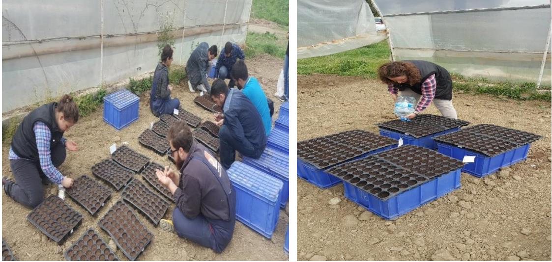
Şekil 4.2: Viyollere tohum ekimi- sulanması.

Viyoller de köklenen bitkiler sıra arası 70, sıra üzeri 50 cm olarak açılan ocaklara 4 Mayıs 2017 tarihinde şaşırtılıp arkasından can suyu verilmiştir. Her ocağa bir bitki gelecek şekilde şaşırtılmıştır. Parseller 4 sıralı ve parsel boyu 5 m uzunluğunda planlanarak, parsel büyüklükleri 2.80 \times 5 = 14 \text{ m}^2 boyutunda kurulmuştur. Fideler tarlaya şaşırtılırken dekara saf 7.5 kg N, 6 kg \text{P}_2\text{O}_5 , 6 kg \text{K}_2\text{O} olacak şekilde taban gübresi verilmiştir. Fidelerin toprağa tutunma aşamasında sulama yapılmıştır. Bitkiler 30- 40 cm olduğunda 7.5 \text{ kg da}^{-1} saf N olacak şekilde ikinci gübre uygulanmıştır. Yabancı ot mücadelesi de gerekli olduğu aşamalarda elle yapılmıştır.