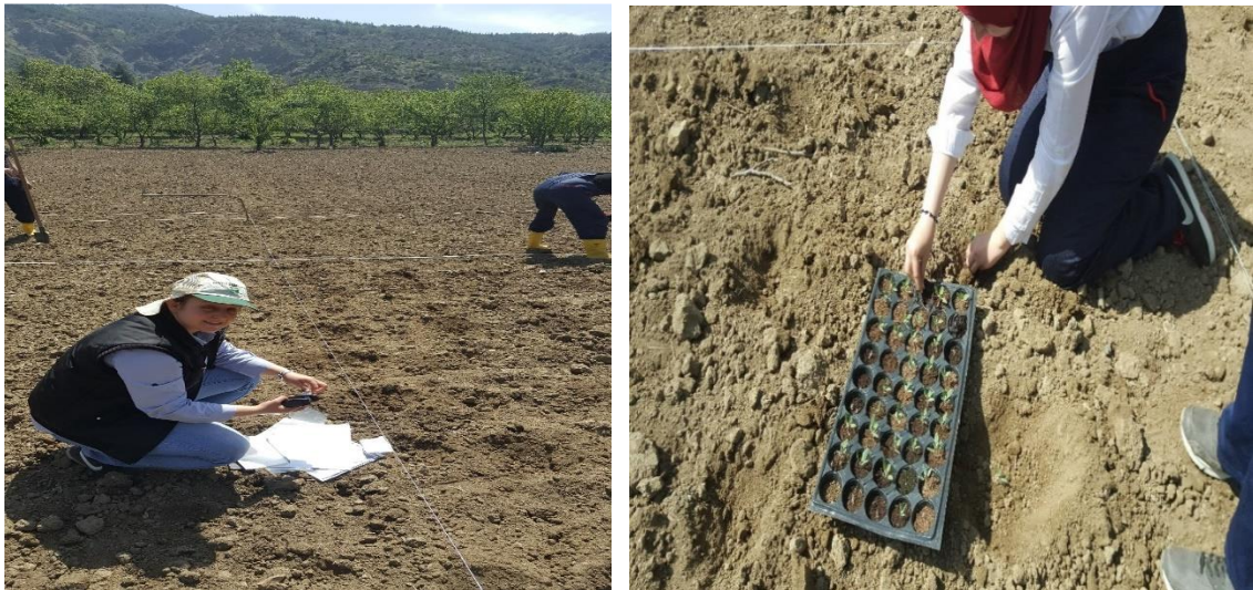
Şekil 4.3: Kinoaı tarlaya şaşırtma.

Viyoller de köklenen bitkiler sıra arası 70, sıra üzeri 50 cm olarak açılan ocaklara 4 Mayıs 2017 tarihinde şaşırtılıp arkasından can suyu verilmiştir. Her ocağa bir bitki gelecek şekilde şaşırtılmıştır. Parseller 4 sıralı ve parsel boyu 5 m uzunluğunda planlanarak, parsel büyüklükleri 2.80 \times 5 = 14 \text{ m}^2 boyutunda kurulmuştur. Fideler tarlaya şaşırtılırken dekara saf 7.5 kg N, 6 kg \text{P}_2\text{O}_5 , 6 kg \text{K}_2\text{O} olacak şekilde taban gübresi verilmiştir. Fidelerin toprağa tutunma aşamasında sulama yapılmıştır. Bitkiler 30- 40 cm olduğunda 7.5 \text{ kg da}^{-1} saf N olacak şekilde ikinci gübre uygulanmıştır. Yabancı ot mücadelesi de gerekli olduğu aşamalarda elle yapılmıştır.