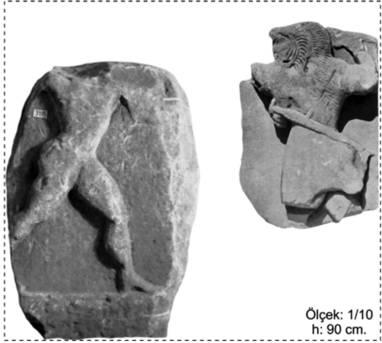
Resim 3: Edincik Buluntusu Rölyefler (Erpehlivan, 2018, Resim 6.81).

Kyzikos kent çevresinden bulunmuş ve kültle ilgili bir eser de İstanbul Arkeoloji Müzeleri'nde 1211 envanter numarası ile kayıtlı kabartmadır. Eserin bir benzeri de Bursa Arkeoloji Müzesi'nde 3115 envanter numarası ile korunmaktadır. Gerek boyutlar gerekse üslup olarak benzeşen eserlerin ikisi de Kyzikos'un güneybatısındaki yüksek tepeler üzerinde konulanmış Edincik'den gelmektedir. MÖ 6. yüzyılın sonlarına tarihlendirilen İstanbul'daki kabartma,