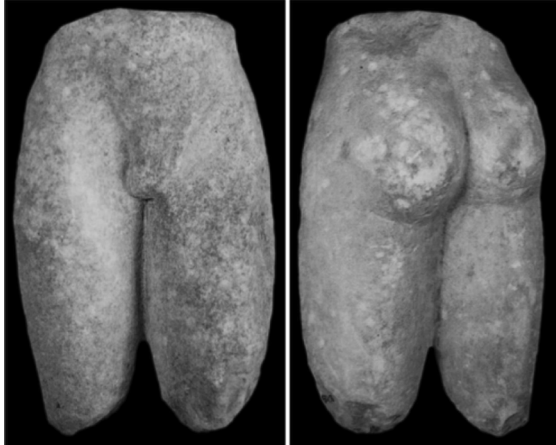
Resim 8: Yenikapı Kourosu (Pasinli, 2009, Kat. 131).

Byzantion'un tıpkı komşusu Kalkhedon gibi, Bosporos çıkışında, bugün Rumeli Kavağı'na lokalize edilen bir Hieronu vardır. Polybios tarafından aktarıldığına göre karşı kıyısındaki Kalkhedon Hieronu'nun 12 stadia uzaklıkla bir Sarapis tapınağı vardır (Pol. IV,39.6). Burada, Dionysios Byzantios tarafından anlatıldığı üzere Sarapis'in yanı sıra bir de Phryg Tanrıçası (Kybele) Tapınağı bulunmaktadır (Dion. Byz. 75) ancak tapınağın tarihçesi ile ilgili başka veri yoktur.