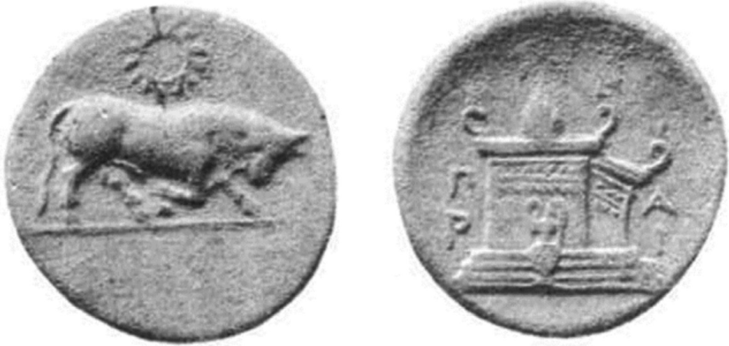
Resim 1: Sunak Betimli Parion Sikkesi (BMC Mysia, Parium 40).

Hellespontos'dan sonra Propontis'in ilk kentlerinden olan Parion, bugün Çanakkale, Biga, Ke-mer köyünün hemen kuzeyinde yer alır. Kentte bugüne kadarki çalışmalarla Arkaik ve Klasik Dönem'e dair bulgular elde edilmiş olmasına rağmen mimari yapı ve epigrafi alanında pek veri yoktur. Antik kaynaklardan öğrenildiğine göre yakınlarındaki Adrasteia'da bulunan Apollon Aktaios ve Artemis [- -] 4 kutsal alanın blokları ile Parion'da bir stadion genişliğinde bir sunak inşa edilmiştir (Strab. XIII.1.13, X.5.7). Modern kaynaklarca bu inşa faaliyetinin M.Ö. 4. yüzyılda yapılmış olacağı, MÖ 4. yüzyılın ikinci yarısına tarihlenen bronz sikkelere (BMC Mysia, Parium 40 vd.) (Resim 1) dayandırılarak ileri sürülür (Avram, 2004, s. 992).