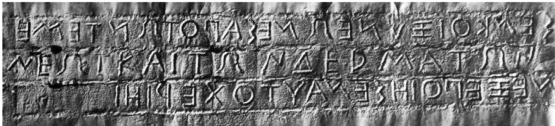
Resim 2: Sidene Tapınak Yazıtının Mulajı (Robert ve Robert, 1950, Pl. X).