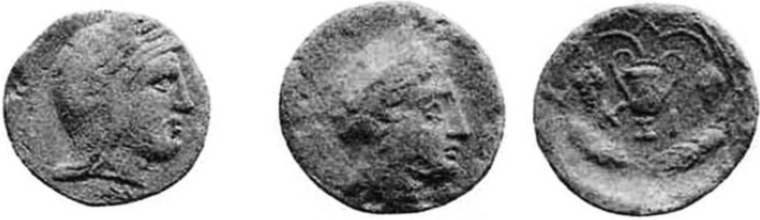
Resim 4: Mithras Betimli Kios Sikkeleri (BMC Bithynia, Pl. XXVIII/13-14).

Kios kültlerine dair bir önemli bilgi de Argoanutika'dan gelir. Kahramanların Kyzikos'dan ayrıldıktan sonra Rhydakos'un ağzını geçtikten sonra Kiosluların topraklarına ulaşırlar. Su almaya giden Hylas burada kaybolur ve Herakles önderliğindeki kahramanlar onu bulamadan bölgeden ayrılmak zorunda kalırlar (Apoll. Rhod. I.1164 vd.). Bu hikâye ile ilgili, kentte Strabon'un döneminde bile dağlara yayılma festivali sırasında, Hylas aranırçasına ormanlarla adının çağırıldığı anlatılmaktadır (Strab. XII.4.3). Yine bununla bağlantılı olarak Herakles'i kentin ktistesisi olarak gösteren Kios sikkeleri vardır (BMC Bithynia, Cius 33). Buna göre kentte bir Herakles kültü olması da kuvvetle muhtemeldir.