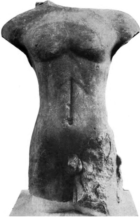
Resim 9: Tekirdağ Kourosu (Bayburtluoğlu, 1970, Lev. I).

Bir antik kente lokalizasyonu tam netleşmemiş olan Tekirdağ il merkezi, özellikle Arkaik Dönem'de kültür ve kutsal alanlar ile ilişkilendirilebilecek heykel buluntuları ile nispeten zengin bir koleksiyon sunmaktadır. Buna rağmen eserlerin çok eski tarihlerde bulunmuş olmaları ve buluntu konteksti bakımından pek veriyi beraberinde getirmemeleri sebebiyle bazı hususlarda soru işaretleri bırakmaktadır. Söz konusu buluntular genellikle Tekirdağ, Rodosto = Rhaidestos, Panidon = Panion ve Bisanthe isimleri ile kaydedilmiştir.