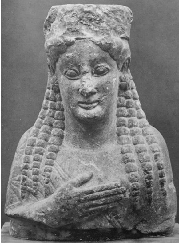
Resim 7: Kalkhedon Koresi (Blümel, 1940, Tafel 44).

Bosporos'un girişindeki iki kentten, doğuda konumlanmış olan Kalkhedon bugün Kadıköy üzerinde lokalize edilir. Tamamen modern yerleşimin altında kalmış olmasına rağmen kurtarma kazılarında gelen arkeolojik veriler sayesinde kent tarihi desteklenmektedir (Türkoğlu, 2017, ss. 6-8; Baran-Çelik, 2018, s. 45, vd.).