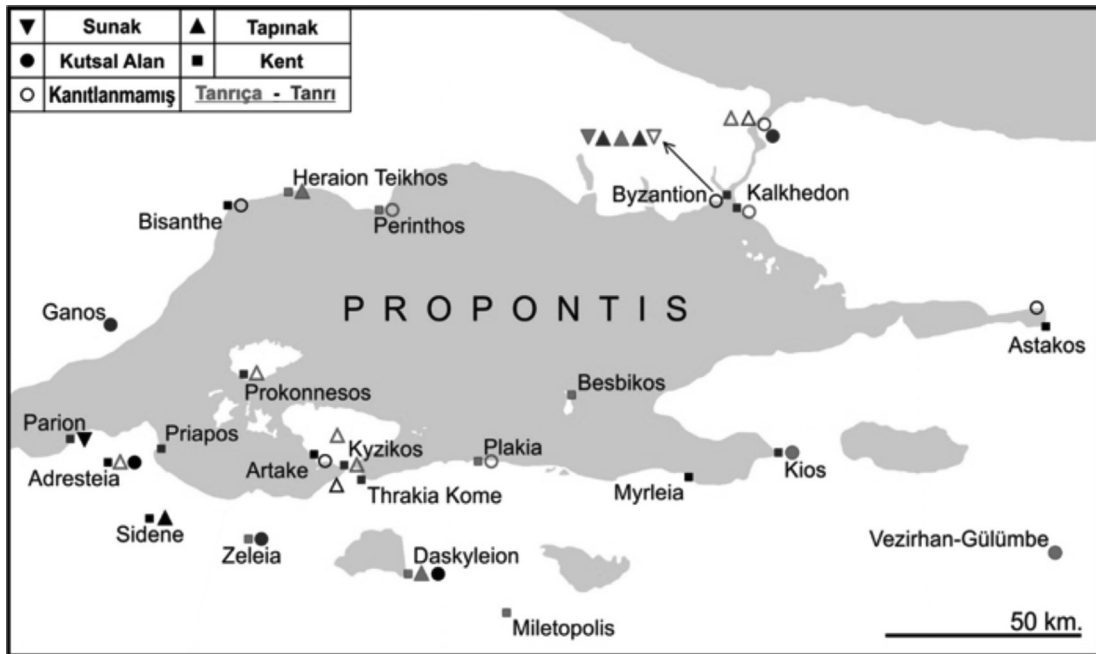
Harita 1: Metinde Anılan Kentler ve Kutsal Alanlar.

Çalışma Arkaik ve Klasik Dönem içinde kalan, yaklaşık M.Ö. 8-4. yüzyıl bulguları üzerinden yapıldığından dolayı elde çok fazla kanıt yoktur. Buna rağmen antik kaynaklar, yazıtlar, sikkeler, heykel ve kabartmalar içerdikleri kültürel veriler açısından değerlendirilecek ve bölge içindeki dağılımları incelenecektir (Harita 1, Tablo 1).