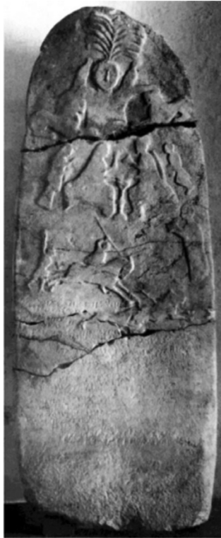
Resim 5: Gülümbe Steli (Neumann, 1997, Abb. 1, Karagöz, 2013, Abb. 90a).

Makale kapsamında anılan ve genellikle antik kentler ile bağlantılanan kutsal alanların aksine, Propontis'in güneydoğusunda, kırsalda konumlanmış kutsal alan, bir adak stelinden bilinmektedir. Stel, bugün Bilecik il merkezinin 10 km kuzeyinde yer alan Gülümbe köyü civarındaki bir noktada tespit edilmiştir. Eserin önce 1968 yılında bir parçası bulunmuş, kalan parçalar ise 1970 yılı kışında yapılan kazı ile bulunarak stel tümlenmiştir. Söz konusu adak steli bugün İstanbul Arkeoloji Müzeleri'nde 6219+71.27 envanter numarası ile korunmaktadır (Karagöz, 2013, s. 36, s. 95) (Resim 5).