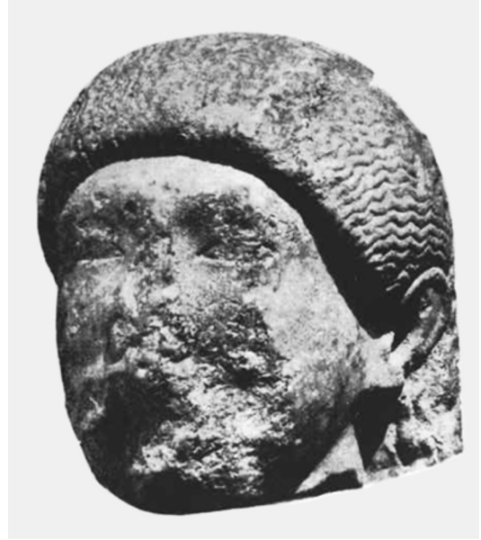
Resim 6: İzmit’te Bulunmuş Kouros Başı (Bayburtluoğlu, 1967, Res. 2).

Eser ile ilgili en ilginç olan husus, körfezin güneyindeki Astakos’dan değil de kuzeyindeki Nikomedia yayılım alanından bulunmuş olmasıdır. Çünkü Astakos nüfusu, MÖ 281’den sonra kurulan Nikomedia’ya yerleştirilmiştir (Strab. XII.4.2). Ayrıca körfezde konumlandığı pek çok kaynak tarafından aktarılan Olbia’nın, Nikomedia ya da Astakos’un eski ismi olduğu iddia edilmektedir. Ancak bu düşünce de Ptolemaios tarafından (Ptol. 5.1.22-24) Astakos, Olbia ve Nikomedia’nın alt alta sıralanması ile çürütülmektedir (Avram, 2004, s. 990). Bugüne kadar yapılan kısıtlı arkeolojik çalışmalarda, Nikomedia kent alanından söz konusu baş haricinde erken dönemlere ait bulgu ele geçmemiştir. Eserin üzerindeki tahribatlar ve harç kalıntıları sayesinde, kullanımı sona