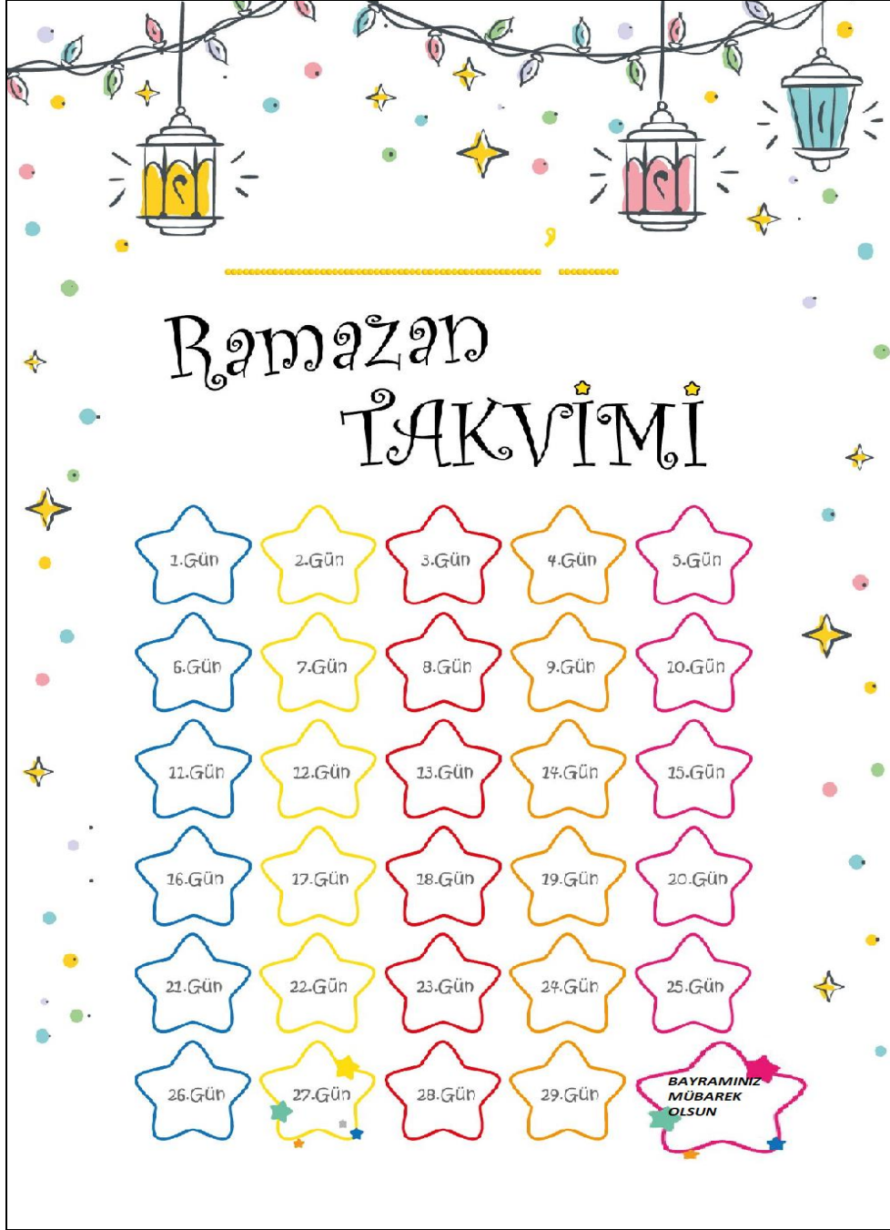
Şekil 3.13. Ramazan Ayı Takvimi