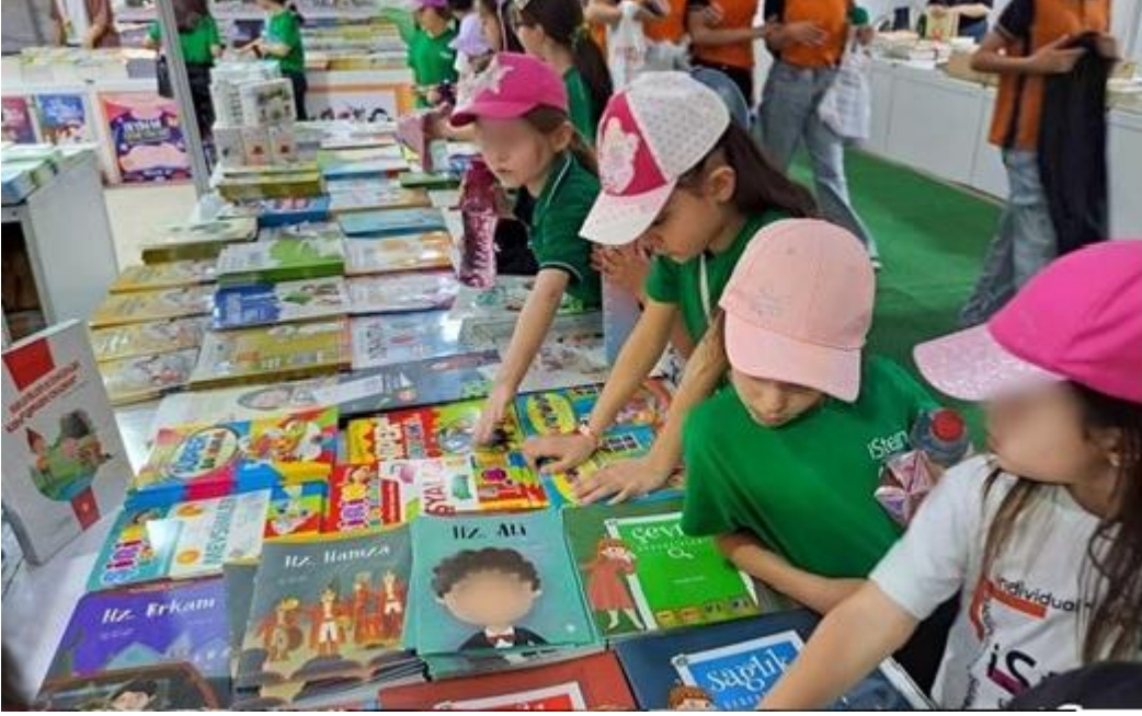
Şekil 3.33. Ramazan Ayı Kitap Fuarı