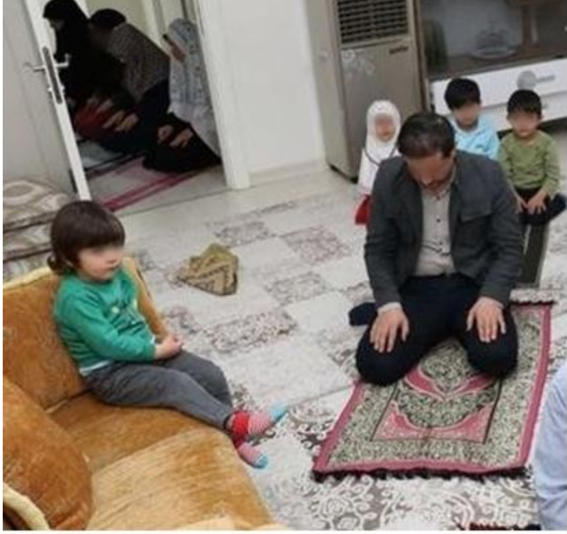
Şekil 3.32. Teravih Namazı

Etkinlik: Evde Çocuklarla Teravih Namazı