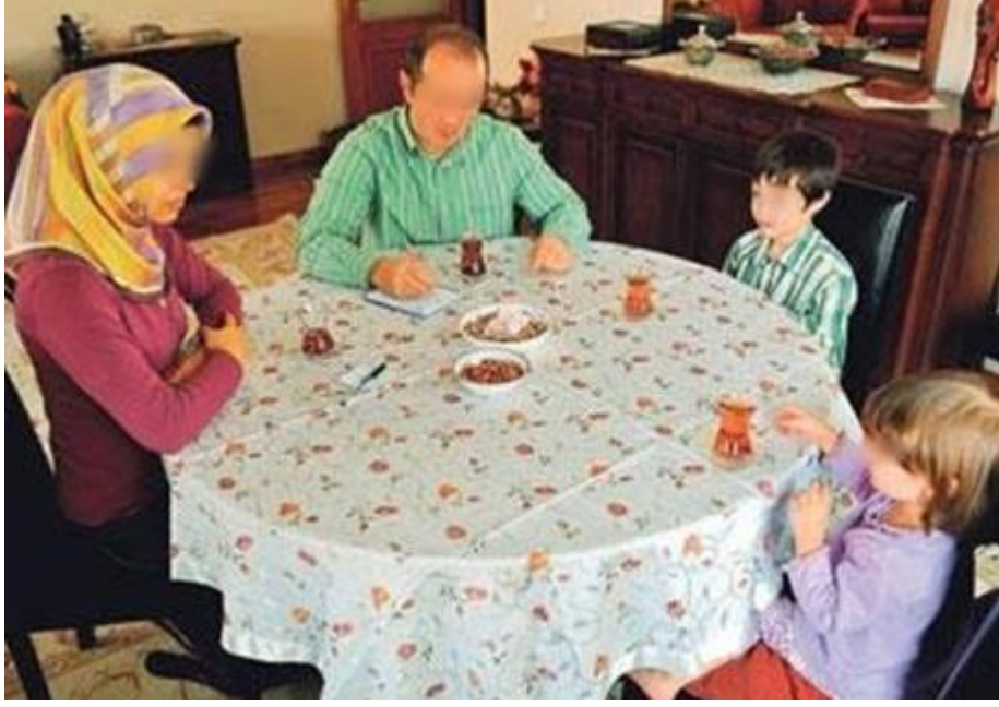
Şekil 3.23. Ramazan Ayı İstişaresi