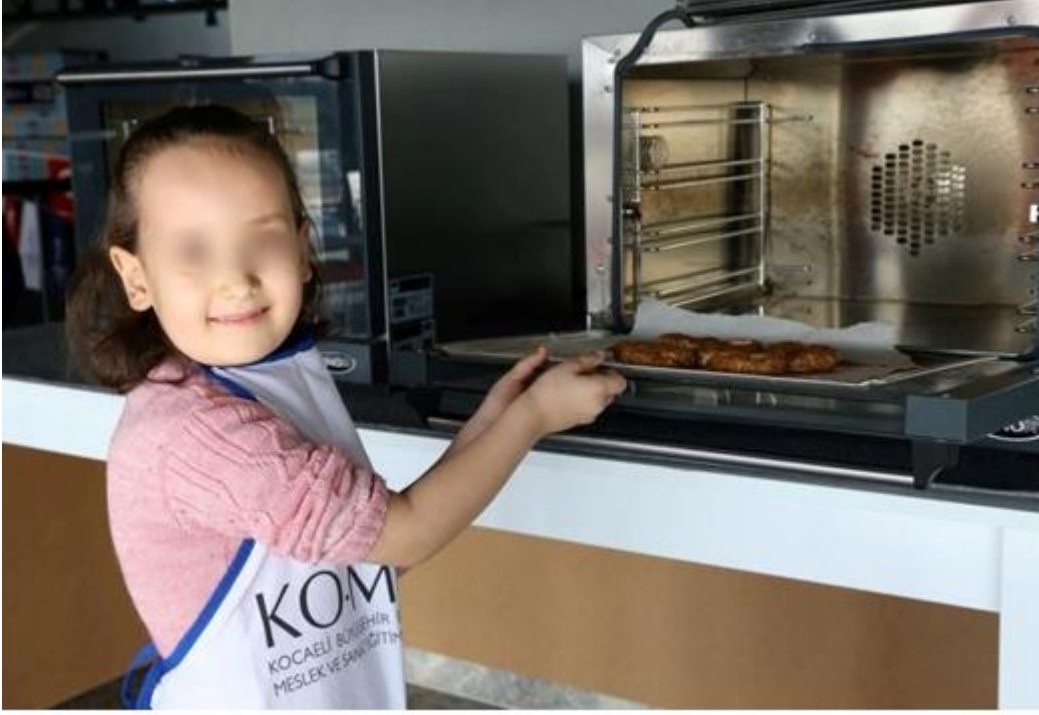
Şekil 3.22. Kandil Simidi Etkinliği