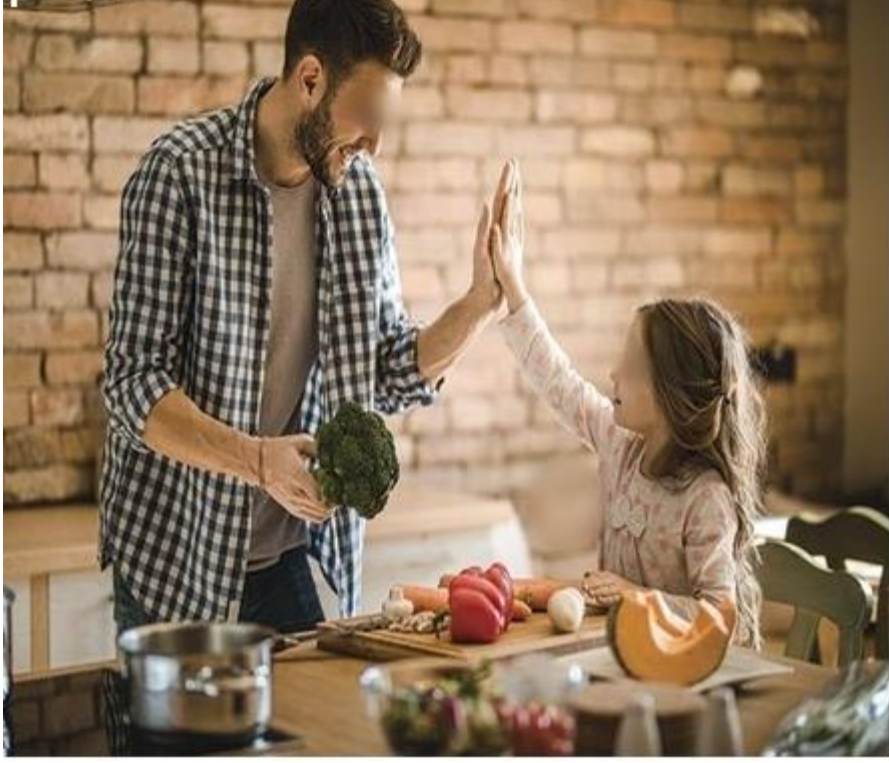
Şekil 3.25. İftar Hazırlığı Etkinliği