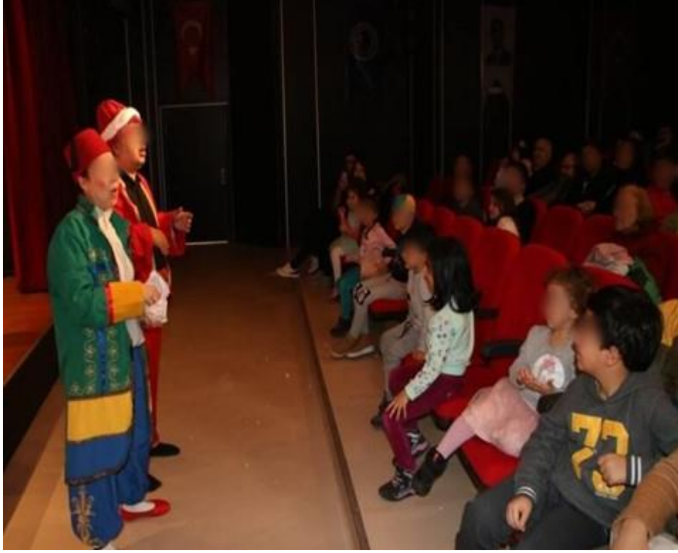
Şekil 3.28. Ramazan Ayı Tiyatro Etkinliği