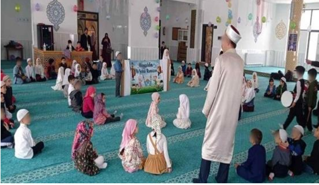
Şekil 3. 6. Camiyi Tanıma Etkinliği