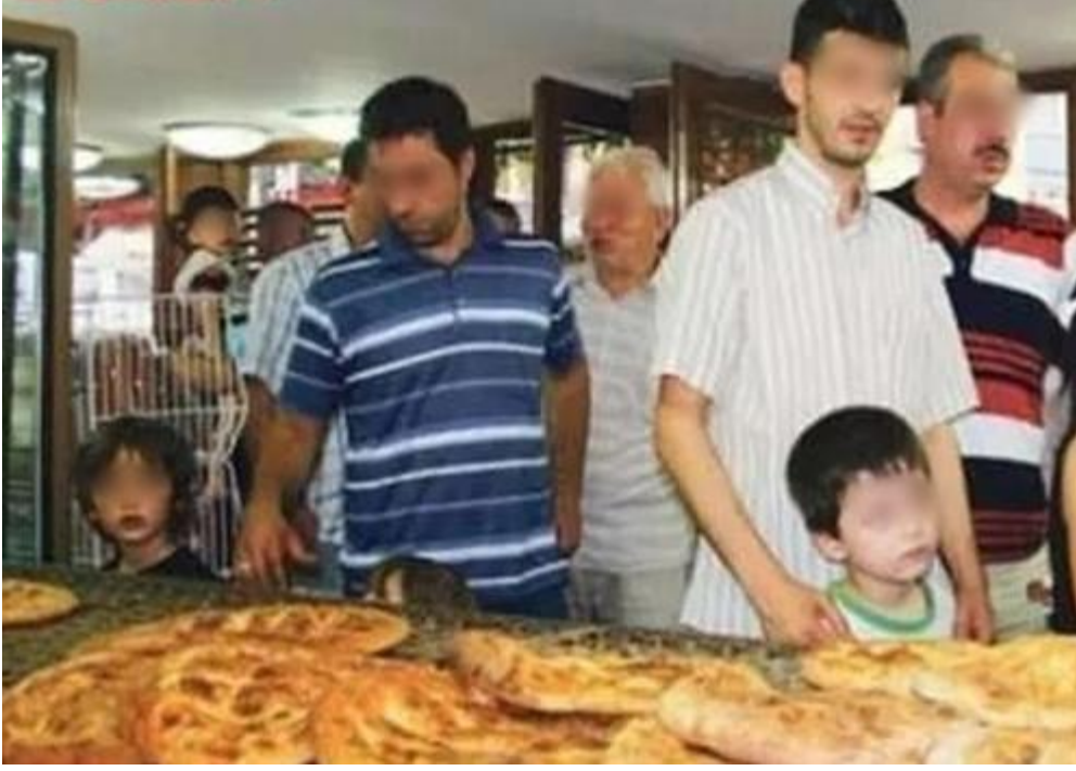
Şekil 3.26. Ramazan Pidesi