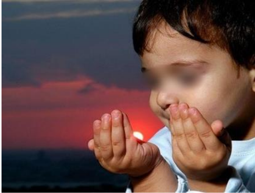
Şekil 3.30. Dua Okuma Etkinliği