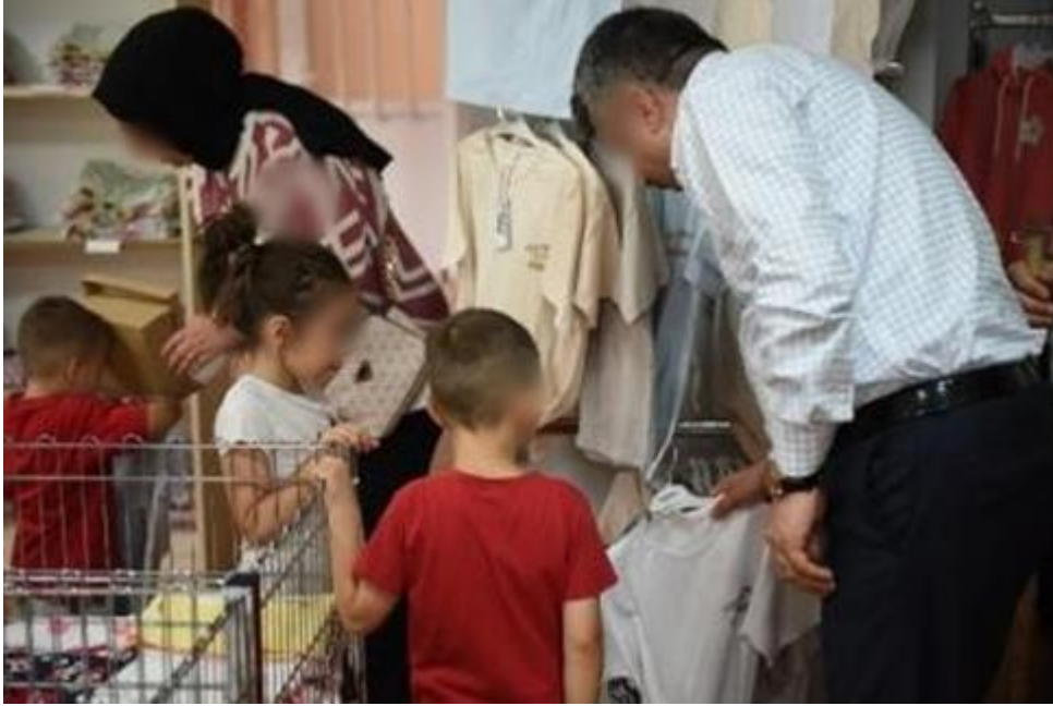
Şekil 3.34. Ramazan Bayram Alışverişi