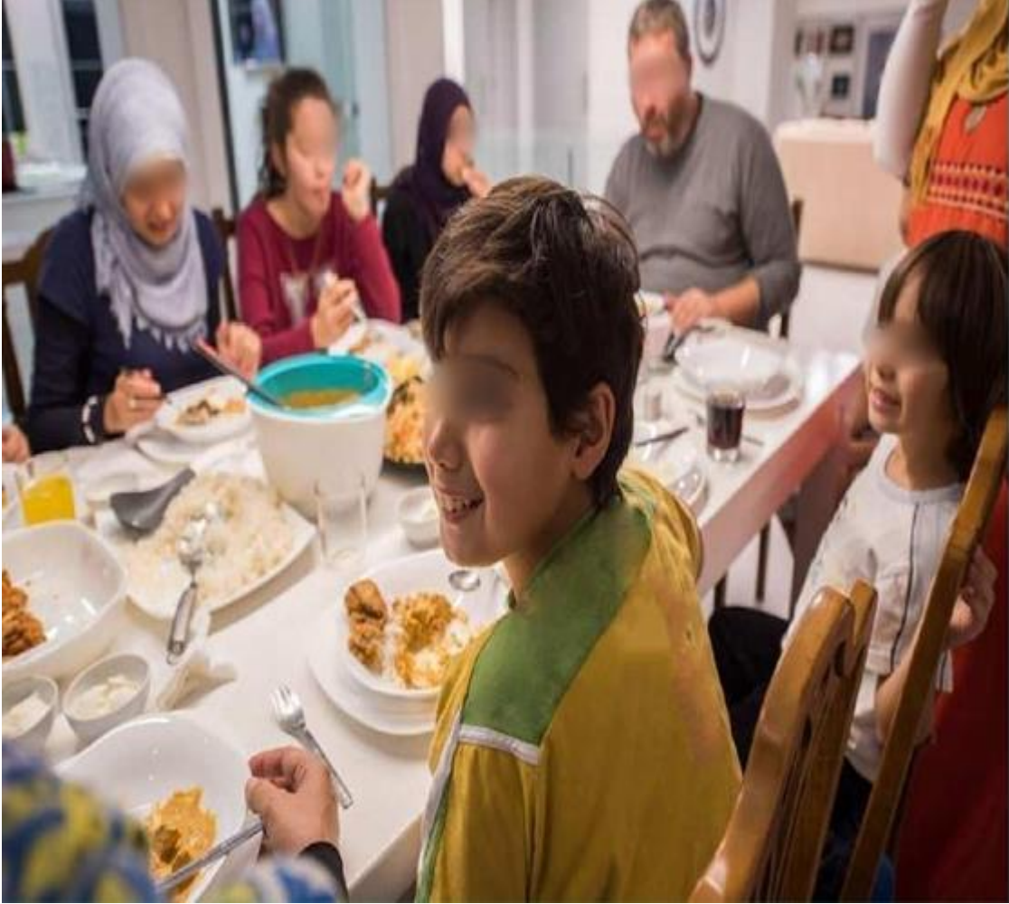
Şekil 3.12. Sofra Adabı