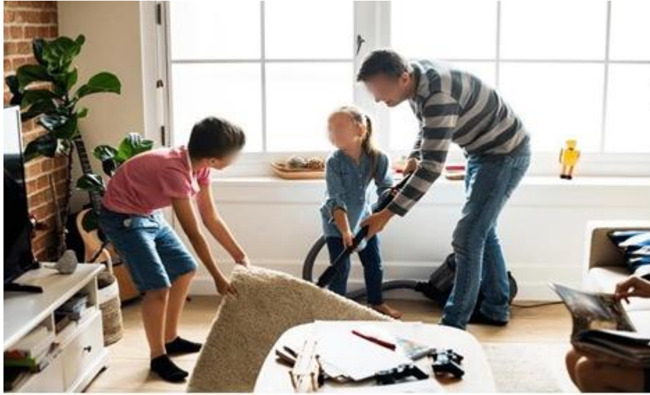
řekil 3.24. Ramazan Ayı Temizliđi

bađlıdır. K. Güz (2016). “Birlikte Yařama Kùltürü Açısından Hılfu'l-Fudùl”, Bozok Üniversitesi İlahiyat Fakùltesi Dergisi , C.10, S.10, s.115-116.