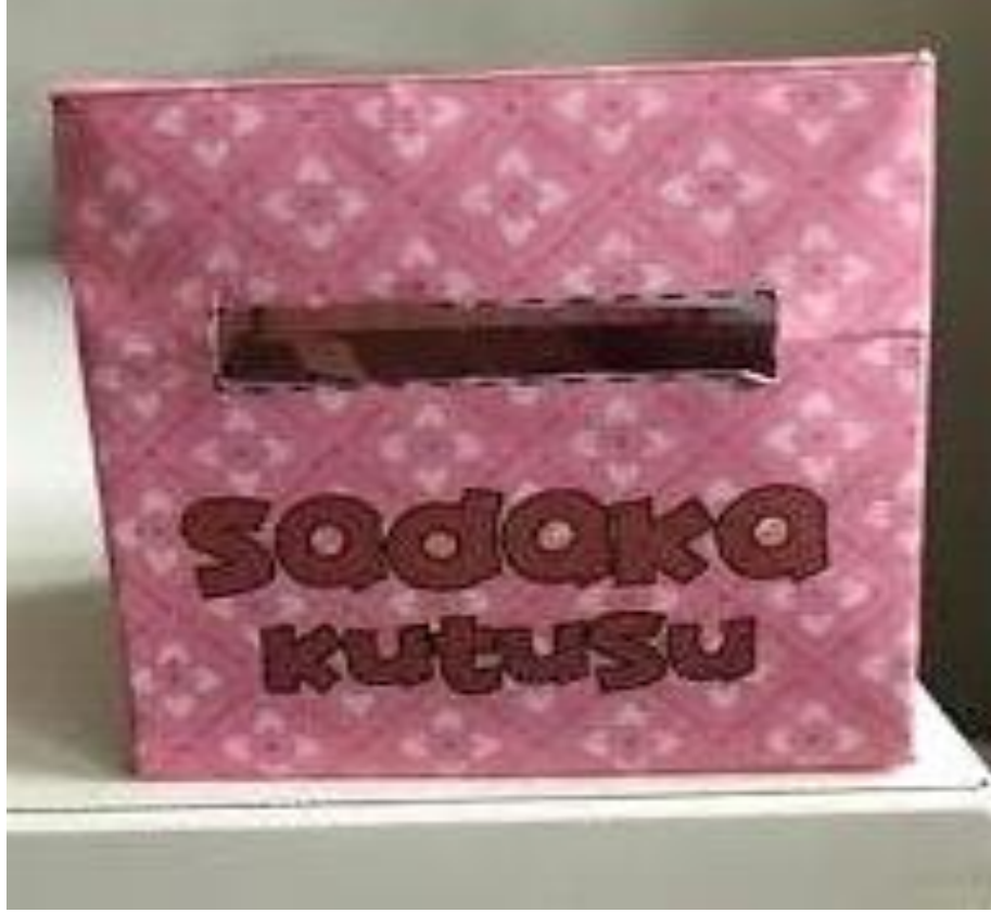
Şekil 3. 7. Sadaka Kutusu