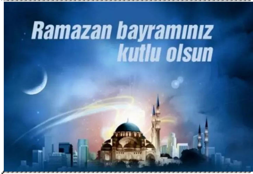
Şekil 3.18. Ramazan Bayramı Kutlama Kartı

Etkinlik : Ramazan Bayramı Kutlama Kartı