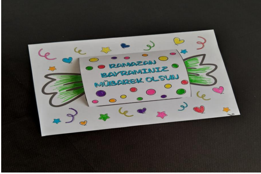
Şekil 3.17. Ramazan Ayı Kutlama Kart Çalışması