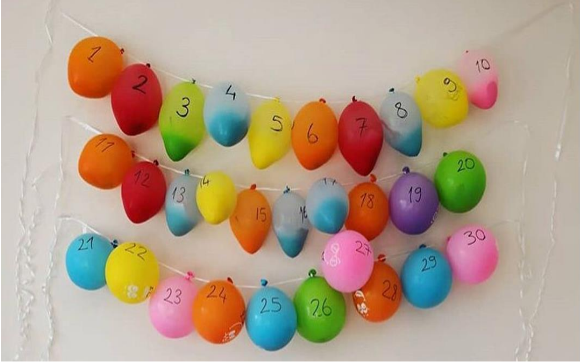
Şekil 3.21. Ramazan Ayı Balon Etkinliği

Etkinlik : Ramazan ayı sürpriz balonları