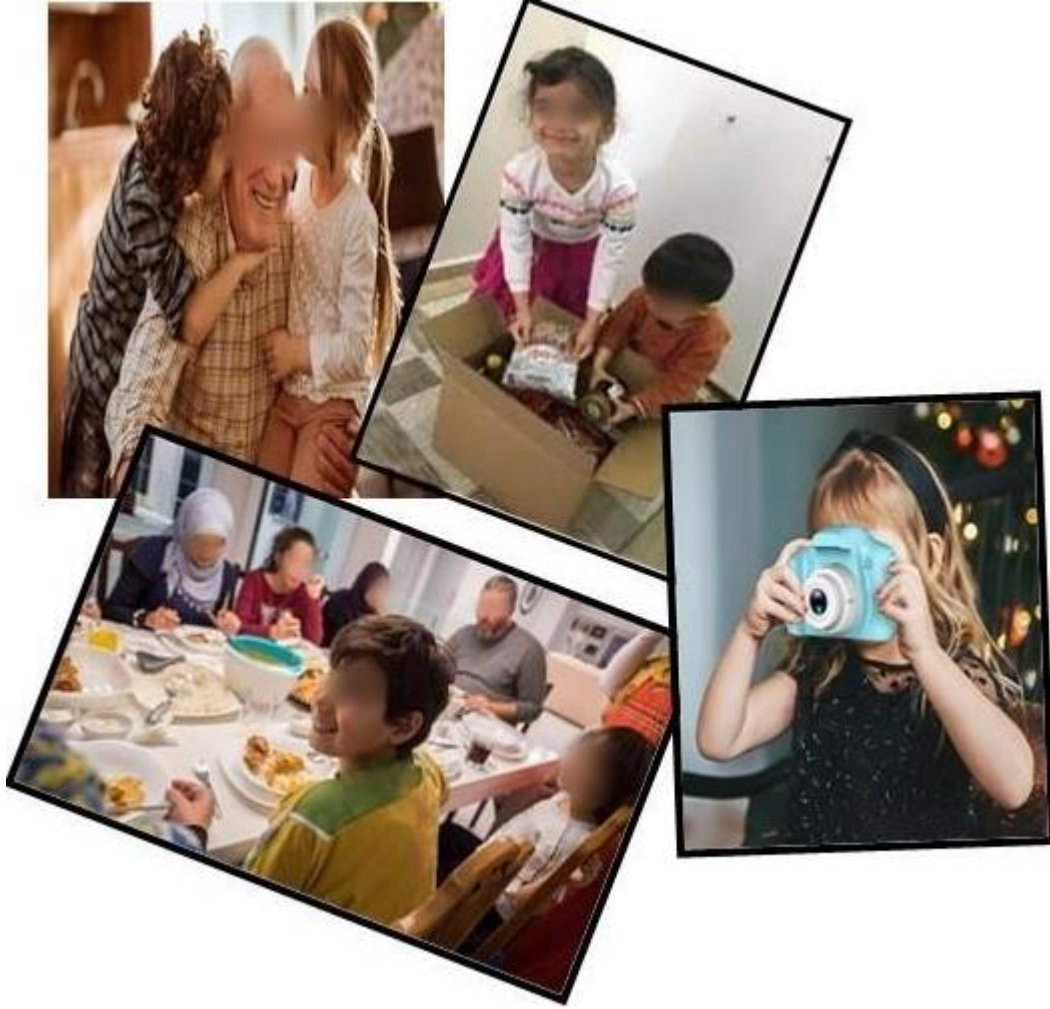
Şekil 3.20. Ramazan Ayı Fotoğrafları