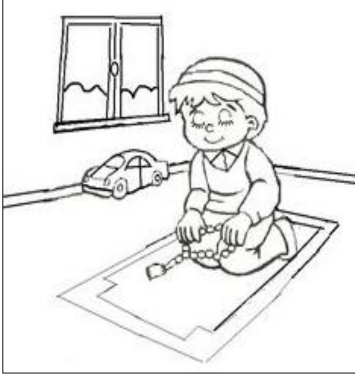
Şekil 3.31. Boyama Etkinliđi