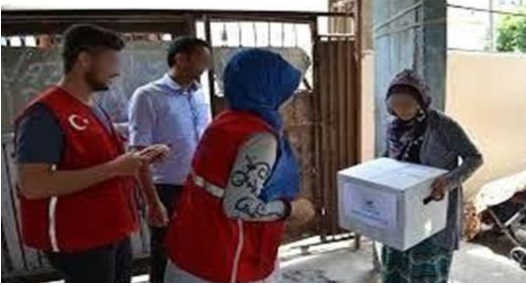
Şekil 3. 8. Zekât Yardımı