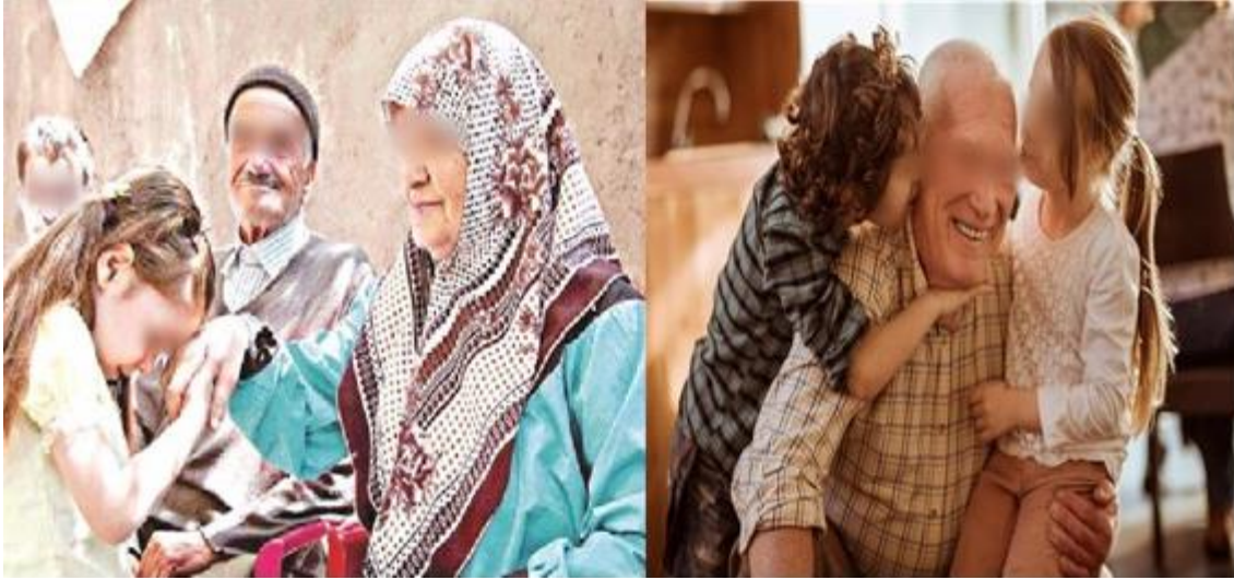
Şekil 3.14. Ramazan Bayram Ziyareti