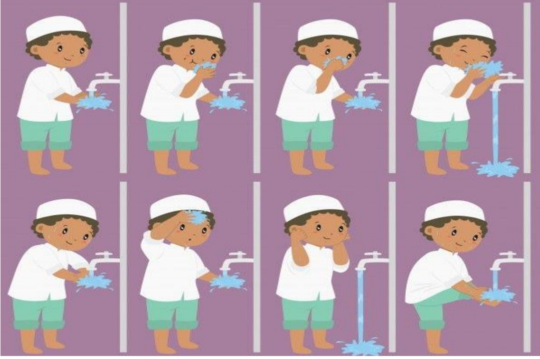
Şekil 3.5. Abdestin Alınışı