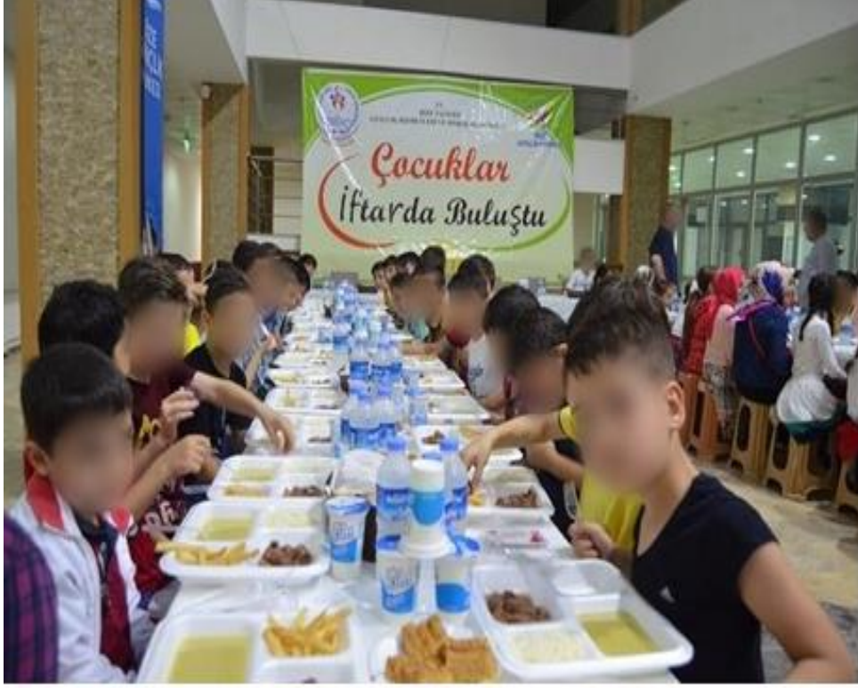
Şekil 3.29. Çocuk İftarı Etkinliği