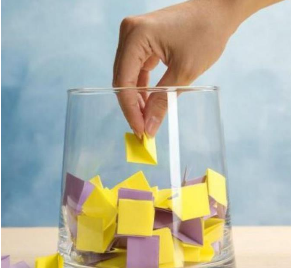
Şekil 3.15. Hazine Avı Oyunu