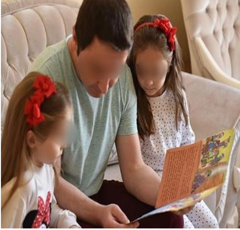
Şekil 3.27. Kadir Gecesi Hikâyesi