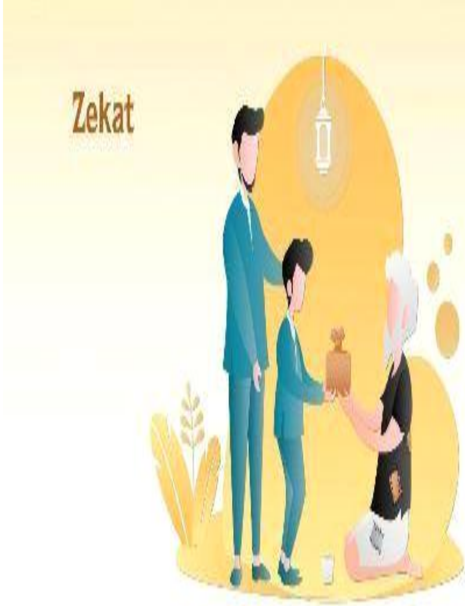
Şekil 3. 9. Dayanışma ve Paylaşma İbadeti Olarak Zekât 277