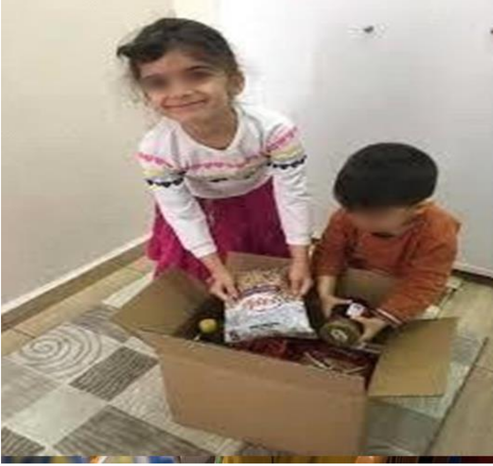
Şekil 3.10. Ramazan Ayı Gıda Yardımı