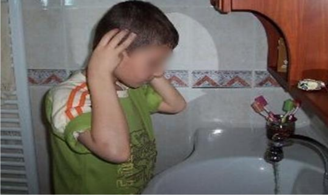
Şekil 3.4. Abdest Almayı Öğrenme