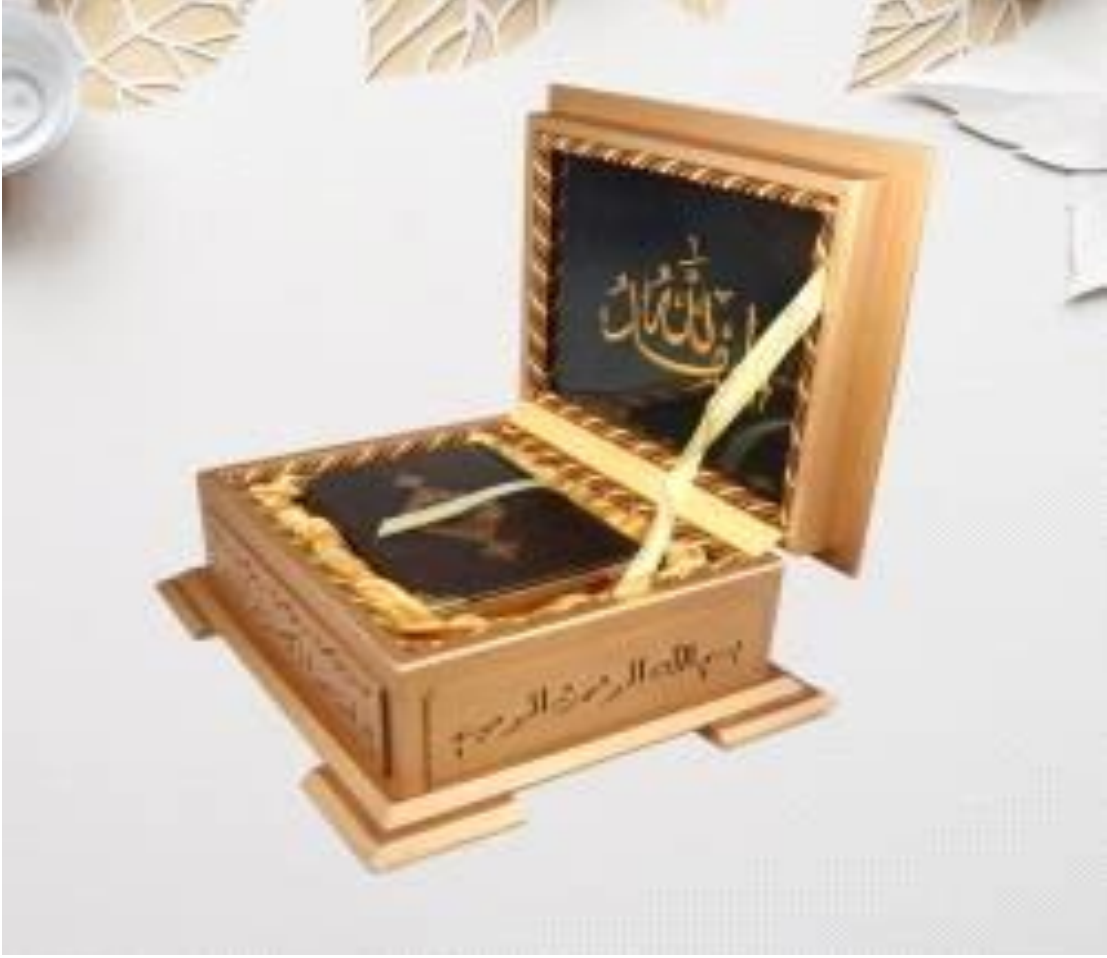
Őekil 3.11. En Gzel Hediye Kur'an-ı Kerim

Etkinlik : Allah (c.c.)'ın Bize En Gzel Hediyesi