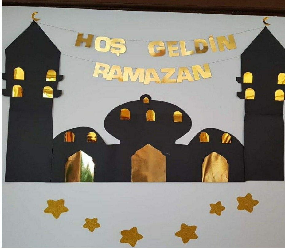
Şekil 3. 1. Hoş Geldin Ramazan Panosu

Etkinlik: Hoş Geldin Ramazan ayı köşesi ve panosu