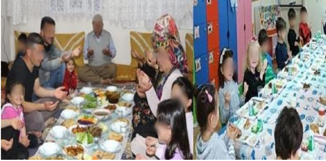
Şekil 3. 3. İftar Davetleri