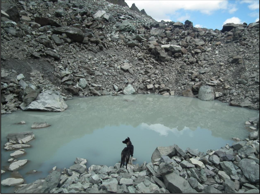
Şekil 5. Karçal kaya buzulu kenarındaki su birikintisi (Görüntü tarihi: 20.08.2013). Figure 5. A puddle which is near of the Karçal rock glacier (View date: 20.08.2013).