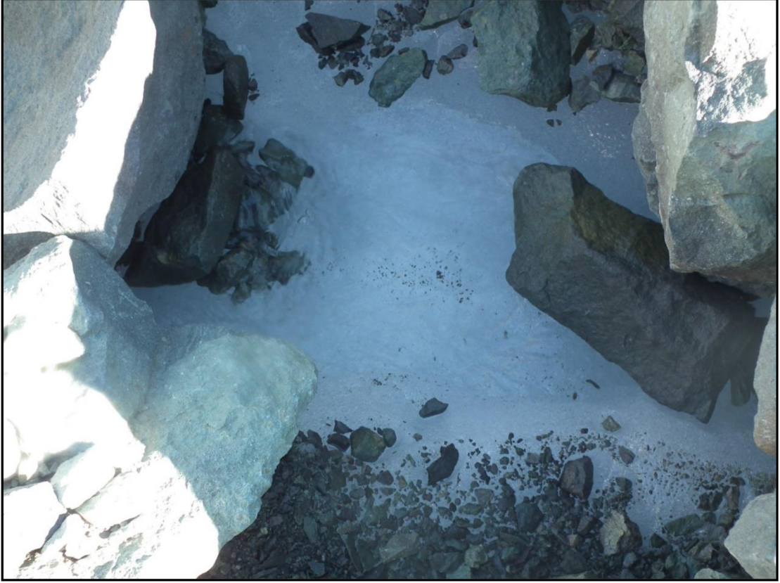
Şekil 4. Gözle görülebilen Sakız buz çekirdeği. Figure 4. Sakız ice core.

me alanları aynı alandır ve gerilemektedir. Kaya buzullarının hareketi sirk yamacına doğrudur. Bu nedenle tartışma yazarının yaptığı yorumların hiç bir geçerliliği yoktur.