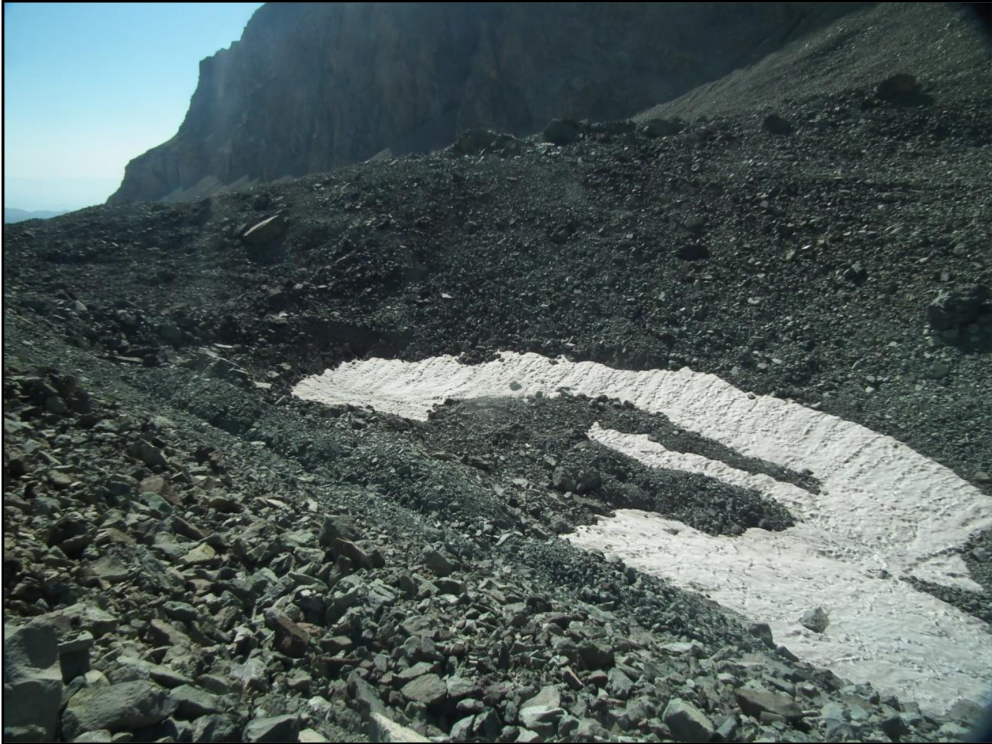
Şekil 6. Tartışma yazarı tarafından varlığı iddia edilen Karçal kaya buzulu supraglasyal gölü (Görüntü tarihi: 14.08.2014). Figure 6. The Karçal rock glacier supraglacial lake which is claimed by the author (View date: 14.08.2014).