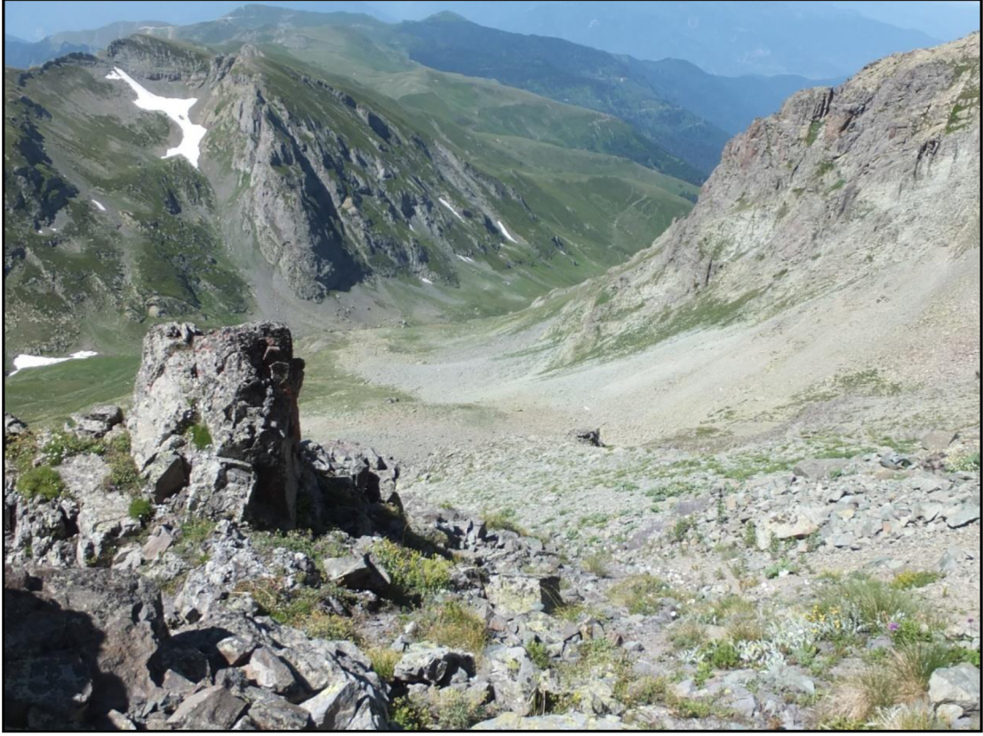
Şekil 3. Tartışma yazarı tarafından kaya buzulu sanılan moloz yığınları. Figure 3. The debris masses are supposed by the author.

ki kaya buzullarının oluştuğu dönemdeki, sıcaklık ve yağış değerlerinin günümüzdekinden daha düşük olduğunu da göz önünde bulundurmak gerekmektedir.