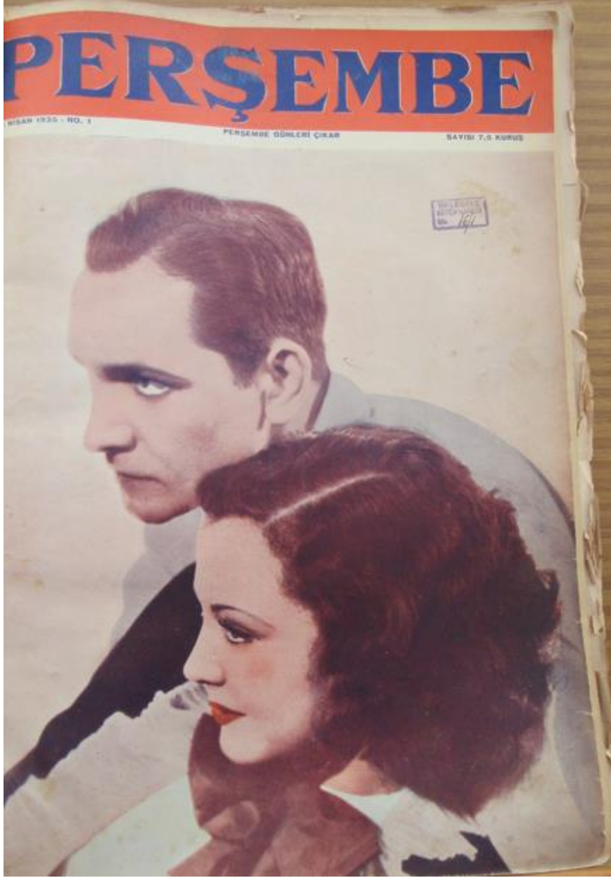
Resim 1: Perşembe Mecmuası 'nın 1. Sayısında Kullanılan Kapak.