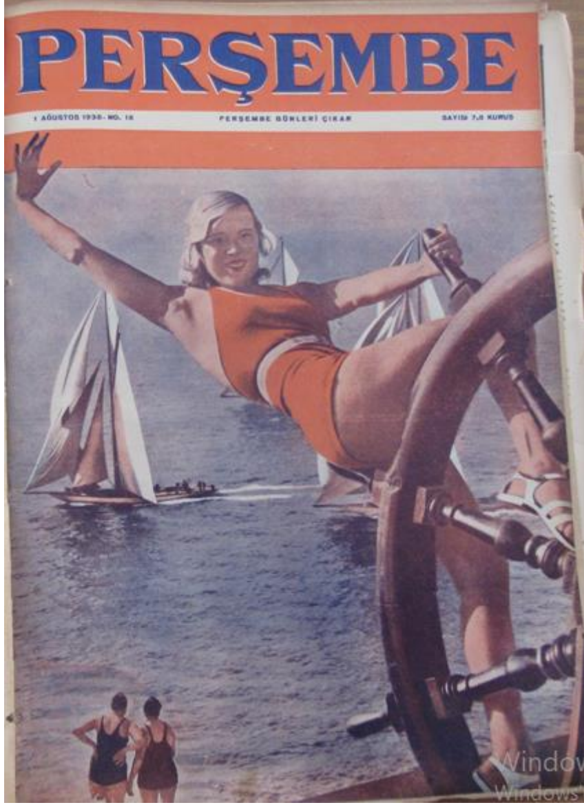
Resim 5: Perşembe Mecmuası 'nın 18. Sayısında Kullanılan Kapak.