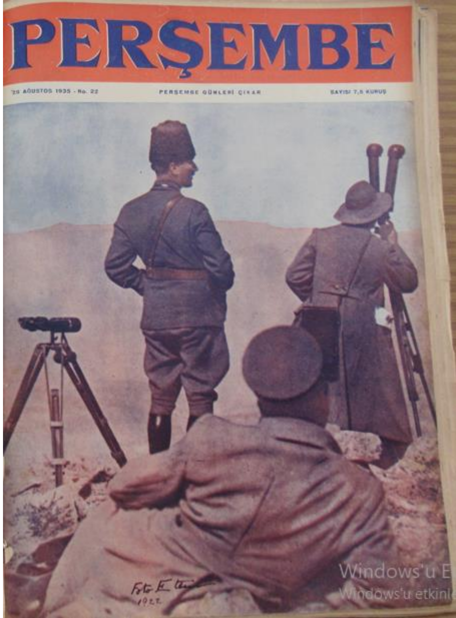
Resim 10: Perşembe Mecmuası 'nın 22. Sayısında Kullanılan Kapak.