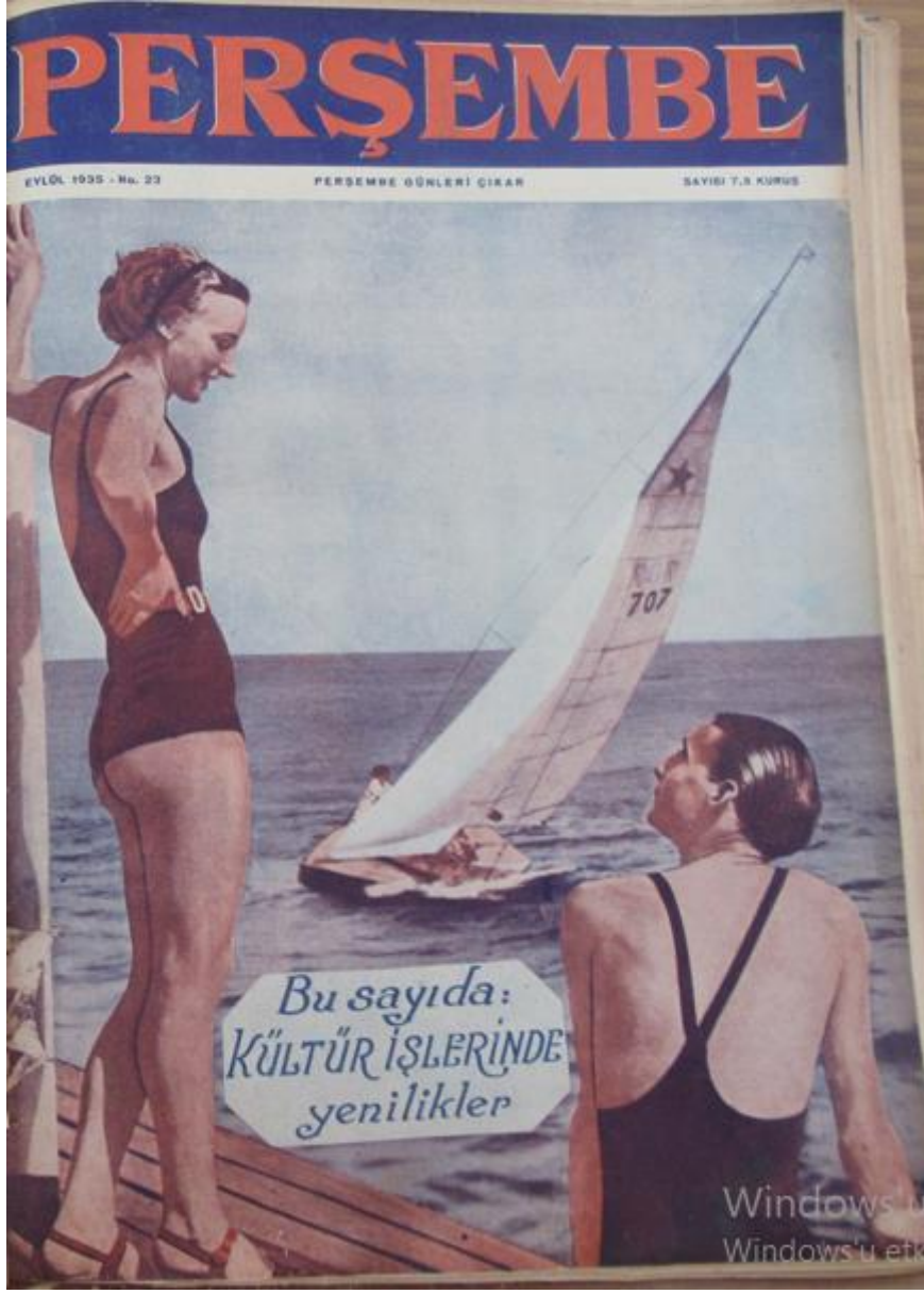
Resim 6: Perşembe Mecmuası'nın 23. Sayısında Kullanılan Kapak.