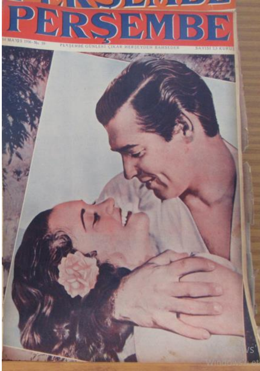
Resim 8: Perşembe Mecmuası 'nın 59. Sayısında Kullanılan Kapak.