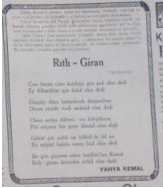
Resim 13: Yahya Kemal'in 16. sayıya yayımlanan "Rıtlı Giran" isimli gazeli.

Kaynak: (Perşembe Mecmuası, S. 16, Temmuz 1935: 3)