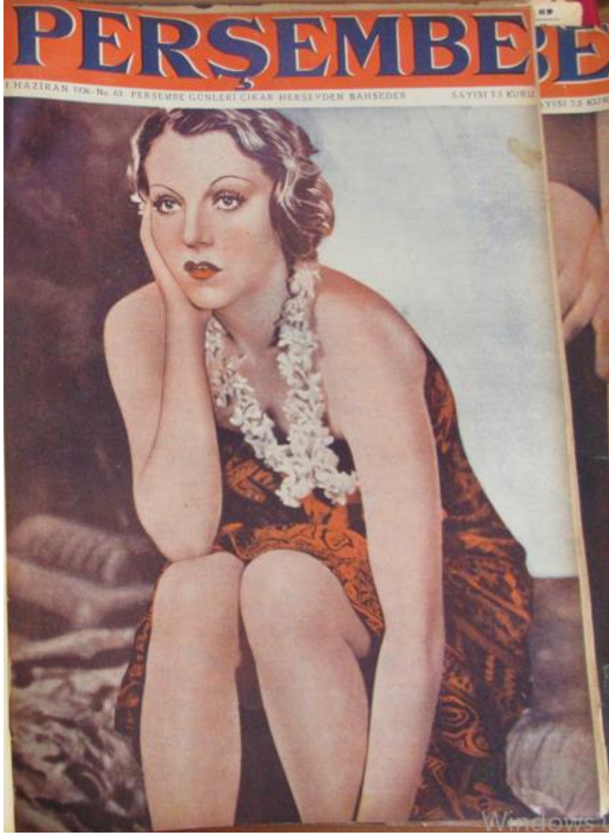
Resim 4: Perşembe Mecmuası 'nın 63. Sayısında Kullanılan Kapak.

Kaynak: ( Perşembe Mecmuası , S. 63, Haziran 1936: 1)