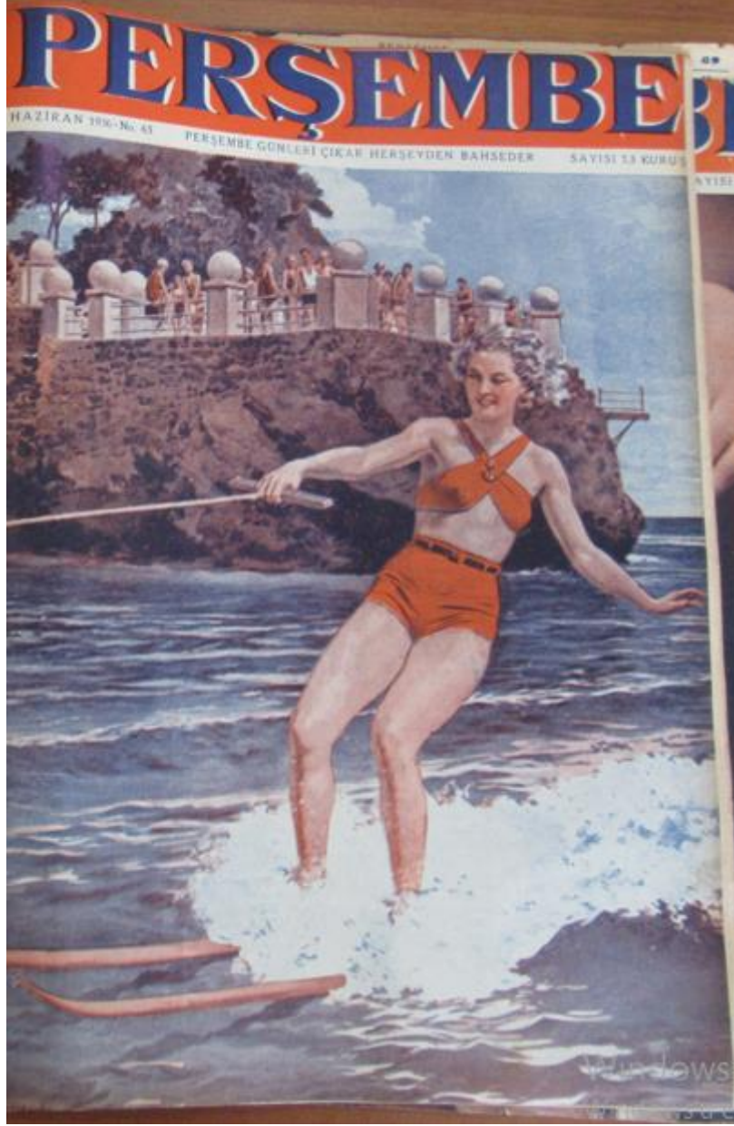
Resim 3: Perşembe Mecmuası 'nın 65. Sayısında Kullanılan Kapak.