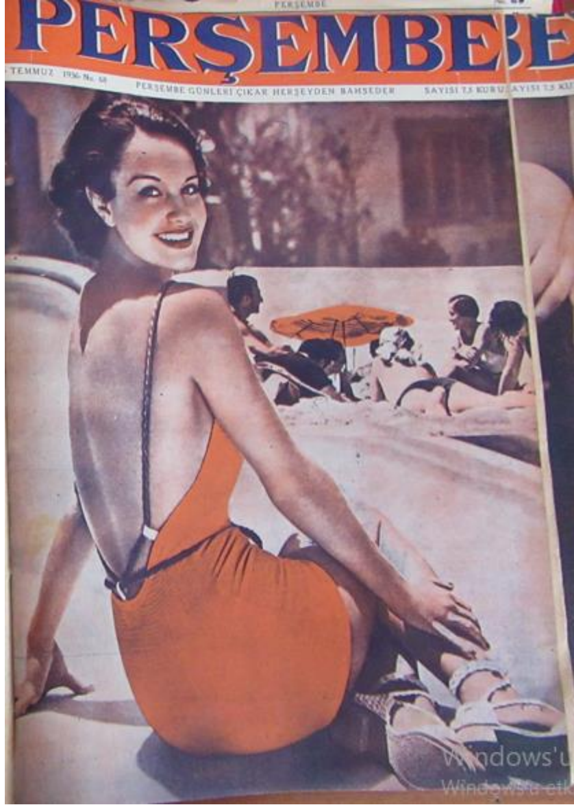
Resim 7: Perşembe Mecmuası 'nın 64. Sayısında Kullanılan Kapak.