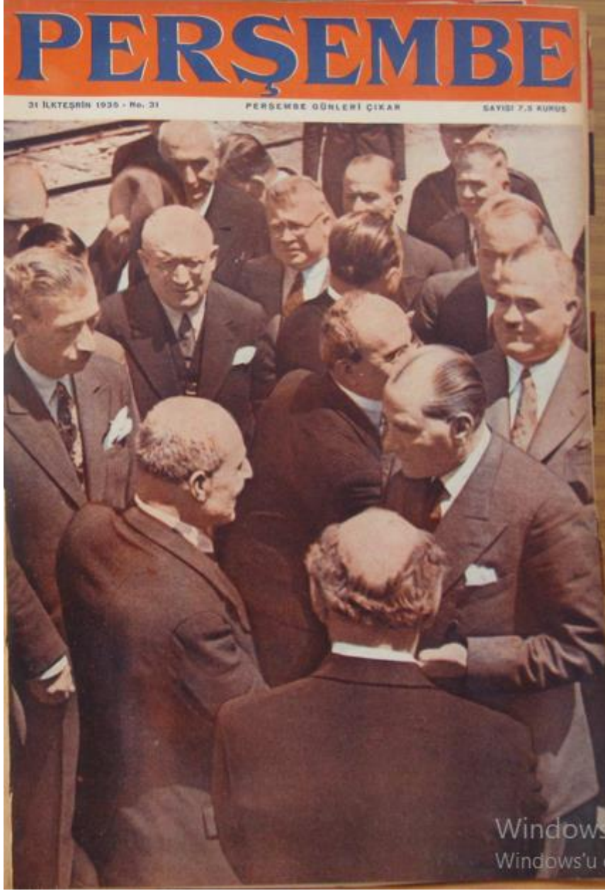
Resim 9: Perşembe Mecmuası 'nın 31. Sayısında Kullanılan Kapak.