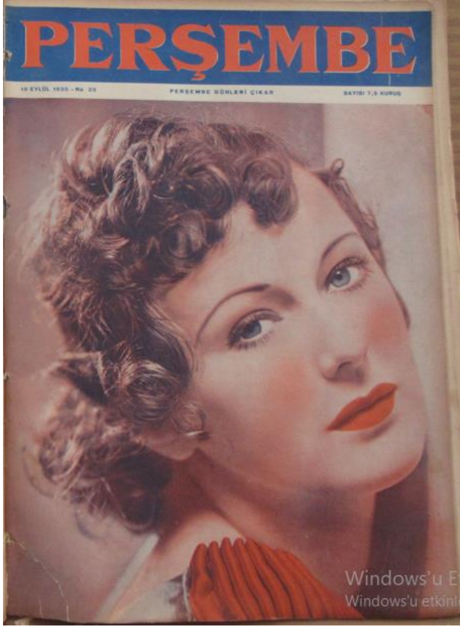
Resim 2: Perşembe Mecmuası 'nın 25. Sayısında Kullanılan Kapak.