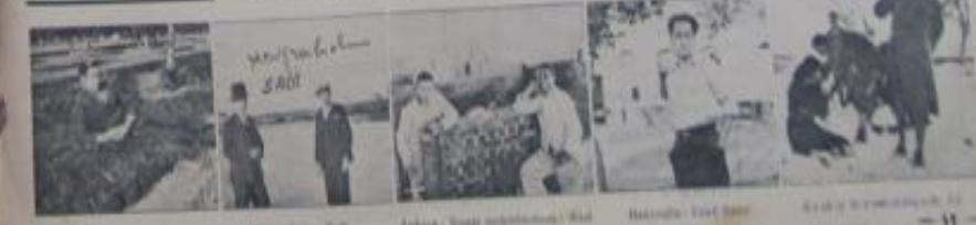
İstanbul - 1935 Beyoğlu - 1935 Beşiktaş - 1935 Kadıköy - 1935 Etiler - 1935