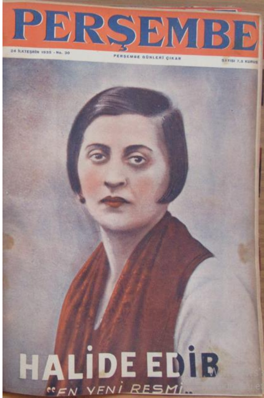
Resim 11: Perşembe Mecmuası 'nın 30. Sayısında Kullanılan Kapak.