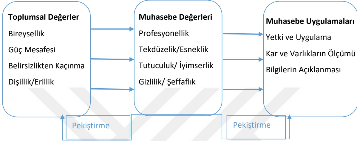
Şekil 4. 3. Gray'in Toplumsal Değerler- Muhasebe Değerleri- Muhasebe Uygulamaları Arasındaki Etkileşim Açıklaması

Gizlilik/ Şeffaflık: İşletmelerin muhasebe kapsamındaki bilgilerinin ne kadarını halka açacağı ile ilgili olan boyutudur. Sermaye piyasası gelişmiş ülkelerde şeffaflık yüksek iken gelişmemiş ülkelerde gizlilik boyutu yüksektir(Karabınar, 2014: 40).