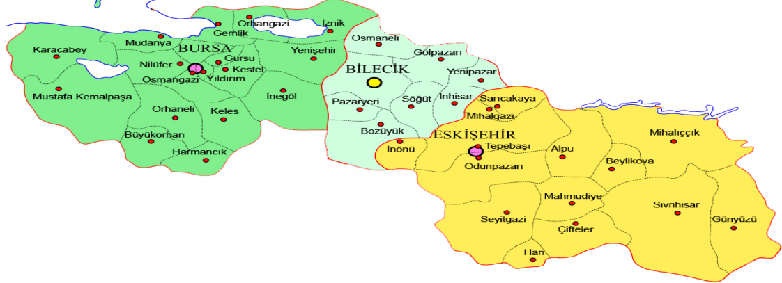
Şekil 2. TR 41 Bölgesi illeri ve ilçeleri (Bursa, Bilecik, Eskişehir)

TR41 Bölgesi, 26 Bölge içinde son verilere göre bitkisel üretim değeri açısından onuncu, hayvansal ürün değeri açısından yirmi ikinci sırada yer almaktadır. TR41 Bölgesi olarak tarımsal üretim değeri incelendiğinde; toplam tarımsal üretim değerinin (bitkisel üretim, hayvansal üretim ve canlı hayvanlar değeri toplamı) %65.09'u bitkisel üretimden gelmekte, hayvansal üretim ve canlı hayvanlar değeri toplam tarımsal üretim değerinin sırasıyla %28.3 ve %6.61'ini oluşturmaktadır. Bölgenin tarım faaliyet kolundaki gayri safi katma değerinin Türkiye tarım değeri içindeki payı yılımız itibariyle %4.28'dir.