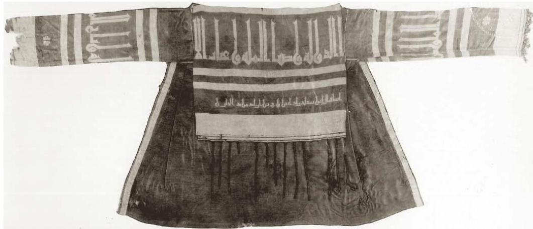
Ek 2. Büveyhî Emîri Bahâüddeve'nin Adını da İçeren İpek Bir Gömlek 156

Kaynak: Encyclopædia Iranica "Safidrud" mad.