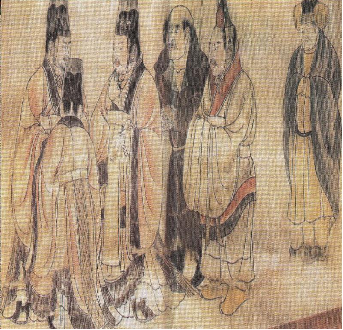
Resim 1: Elçiler