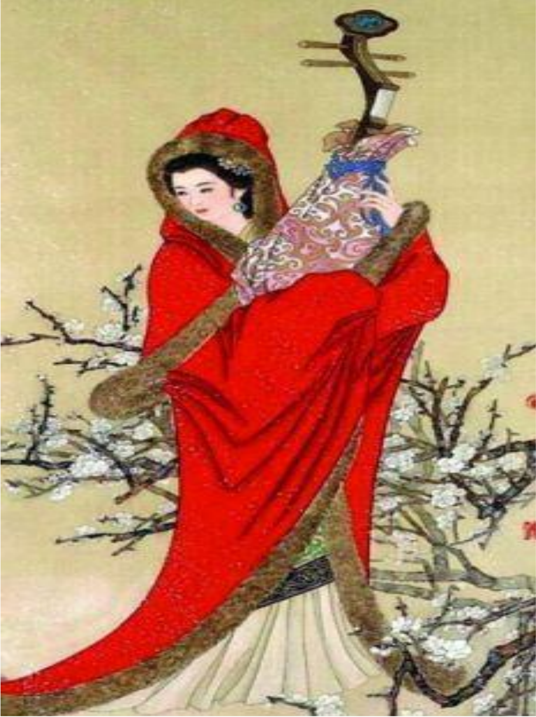
Resim 2: Ünlü Çin Prensesi Wang Zhao Jun