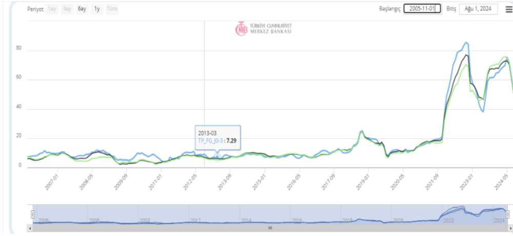
Şekil 1.1. Tüketici Fiyat Endeksi (TÜFE) Yıllık Değişim Oranları