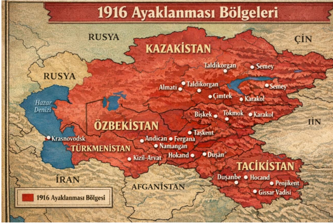
Harita 1.1. 1916 Ayaklanması bölgeleri haritası 34

Ayaklanmalar, farklı gruplar açısından değişen hedefler içermekle birlikte, bağımsızlık ve özerklik yönelimlerini de barındırmıştır. 35 Bunun yanında isyanların ortaya çıkışında birden fazla sebep etkili olmuştur: Rusya'nın tarım politikaları köylülerin topraklarını kaybetmesine ve ekonomik sıkıntılar yaşamasına neden olmuş, demir yolu inşaatı gibi harcamalar ağır ekonomik şartlara rağmen sürdürülmüş, savaş harcamaları nedeniyle vergiler artmış, temel ihtiyaç maddelerinin fiyatları yükselmiş ve enflasyon halkın yaşamını zorlaştırmıştır. Ayrıca Rus yerel yöneticilerin baskıcı tutumları tepki çekmiş, Müslüman halkın cephe gerisi hizmetlerde çalıştırılacak olması, Osmanlı'ya karşı savaş ihtimalini gündeme getirdiğinden büyük huzursuzluk yaratmıştır. 36