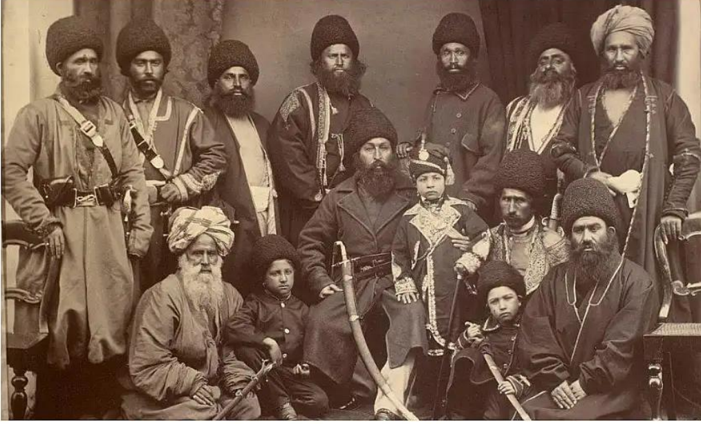
Şekil 2.5. Basmacı Hareketinde yer alan Türkmen Önderleri ve Savaşçılar 185

1926'dan itibaren Afganistan üzerindeki diplomatik baskılar artırılmış, bu da Basmacı hareketinin sığınak bulmasını zorlaştırmıştır. 1929'daki Afgan iç savaşı sonrası, yeni iktidarın Sovyetler'le yakınlaşması sonucu Basmacılar daha da izole hale gelmiştir. 1931 sonrası birçok Basmacı lider ya teslim olmuş ya da Afganistan'ın iç bölgelerine çekilerek etkinliklerini kaybetmiştir. 1934 yılına gelindiğinde Türkmen Basmacı Hareketi büyük oranda sona ermiş; Sovyetler Afganistan sınırında göreceli bir istikrar sağlamıştır. 186