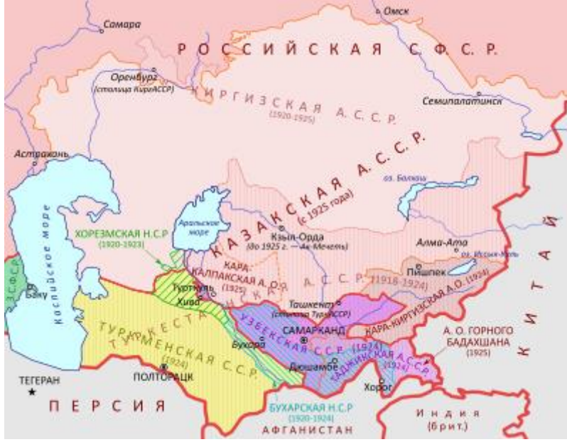
Harita 3.1. 1924 sonrası Türkmen SSC, Özbek SSC, Tacik ASSR, Kazak/Kırgız bölgeleri 220

Lenin'in ulusal parti politikasının bir gereği olarak 1924 yılında devlet personel politikası yeniden düzenlenmiş, vilayetlerdeki devlet kurumlarının ve idari organizasyonların kadroları büyük ölçüde yerel nüfusun temsilcilerinden oluşturulmuştur. Bu çerçevede Türkistan'da yönetime katılan toplam 1.730 işçinin 1.427'si Türkmen, 238'i Rus, 65'i ise diğer etnik gruplara mensuptu. Aynı dönemde Hive ve Buhara Cumhuriyetleri'nde de Türkmenlerin, Özbekistan Cumhuriyeti topraklarından ayrılarak Türkistan Cumhuriyeti'ne katılmalarını öngören çalışmalar yürütülmüştür. 15 Eylül 1924 tarihinde toplanan 3. Olağanüstü Türkmen Merkez Seçim Komisyonu'nda ulusal bölünmeye ilişkin karar kabul edilmiş, 27 Ekim 1924 tarihinde bu karar SSCB tarafından onaylanarak uygulamaya geçirilmiştir. 221