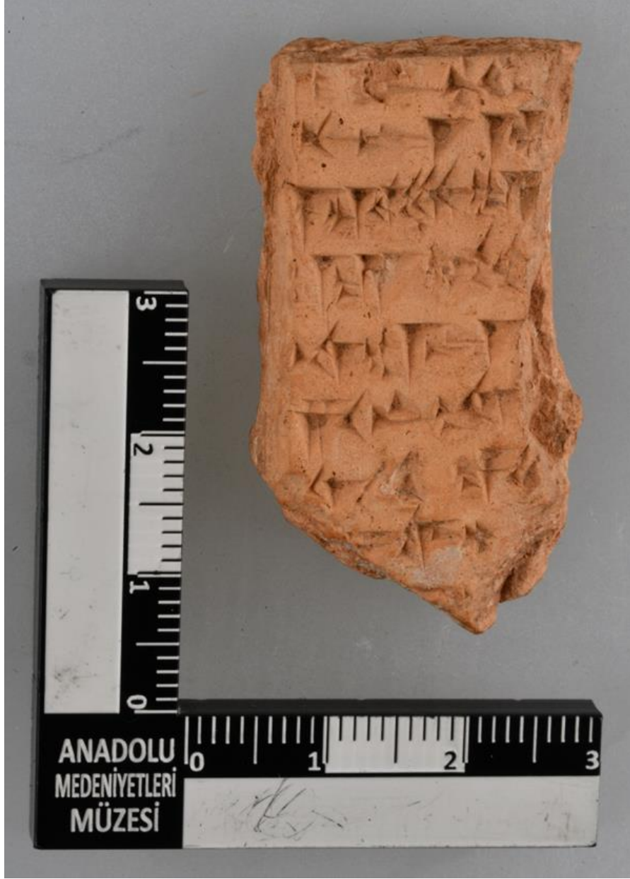
Res. 1. Bo 7825