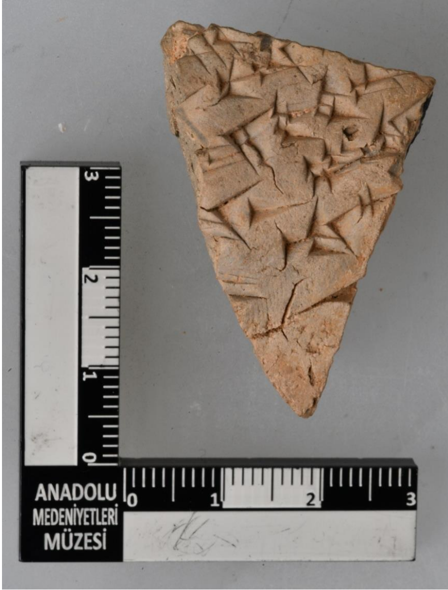
Res.3. Bo 8141