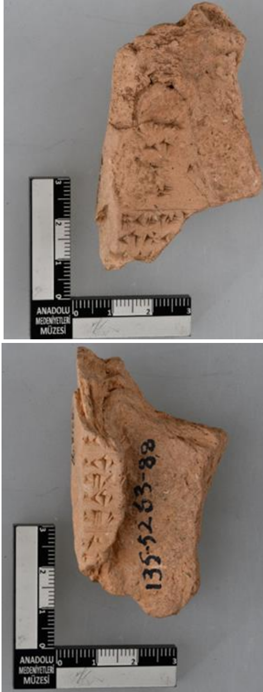
Res. 4. Bo 8168 öy. ve ay.