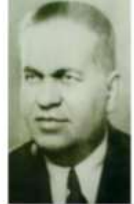
Dr. Lütfi KIRDAR 26.11.1957 - 27.05.1960