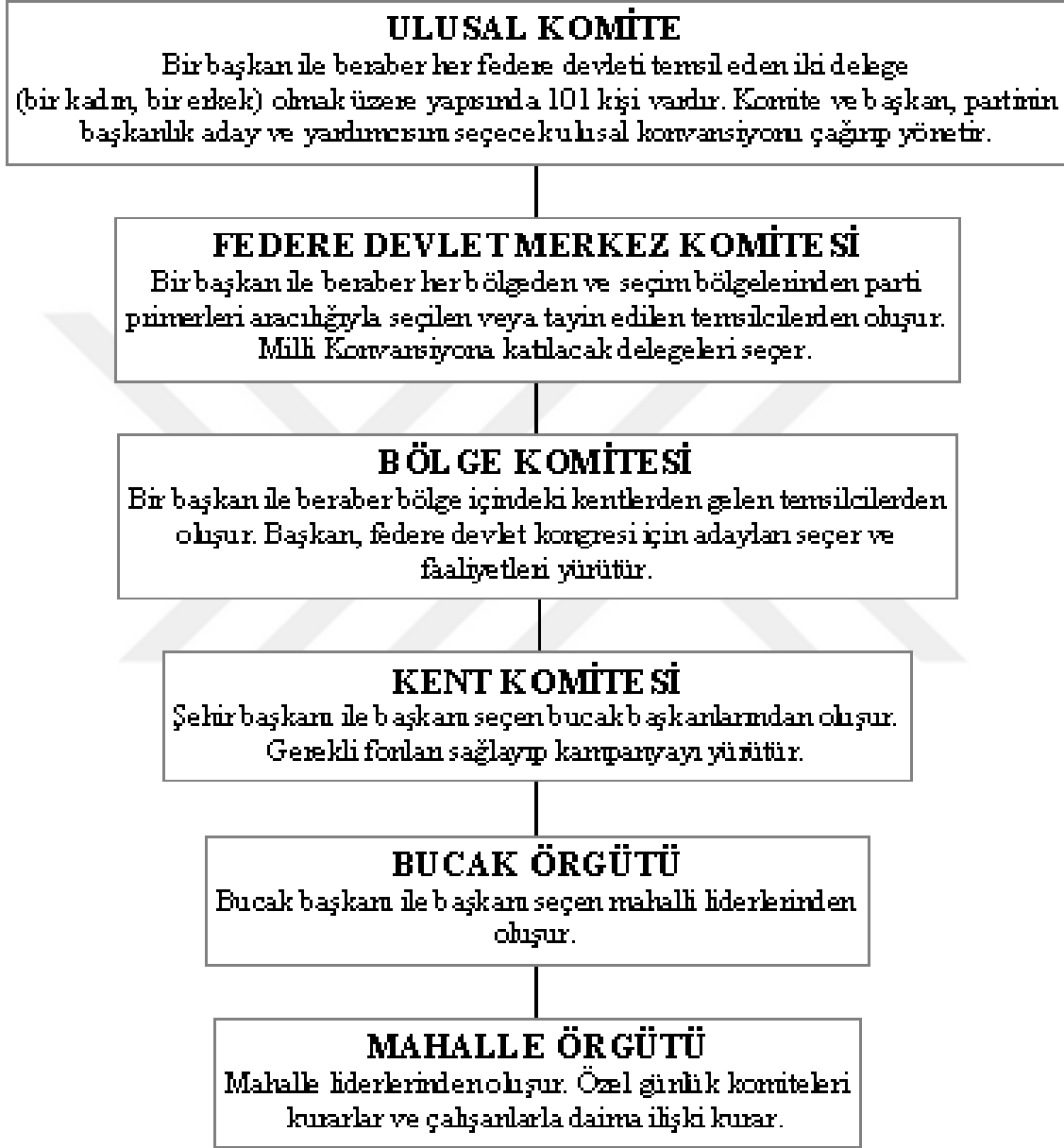
Şekil 1: Amerikan Siyasal Parti Örgütlenmesi

Bu kişiler uzmanlaştıkları alanda seçim dönemlerinde parti içerisinde bulunan birçok seçim ajanının hareketlerini yönlendirebilirler. Rakip adayın/adayların yıpratılması, haklarında yalan haberler yapılarak karalanması ya da gerçek dışı anket düzenlenme gibi konularda son derece ehil kadrolardır. (Berkes, 1946:112)