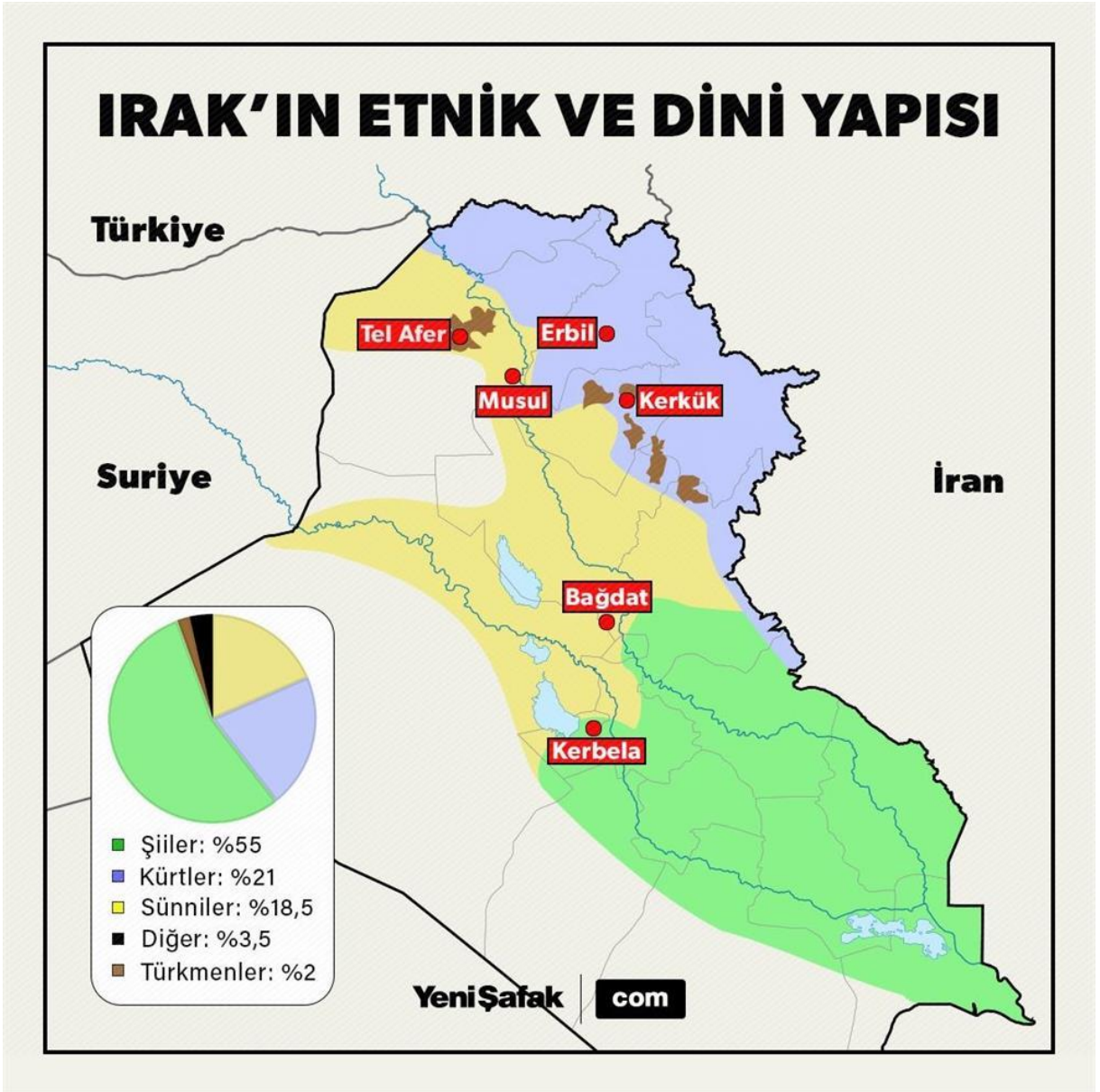
Şekil 4: Irak'ın Etnik ve Dini Yapısı

sonra en büyük etnik gruptur. Kürtlerin büyük çoğunluğu Müslüman ve Müslüman olanların büyük çoğunluğu Sünni'dir. (Kurşun, 2014)