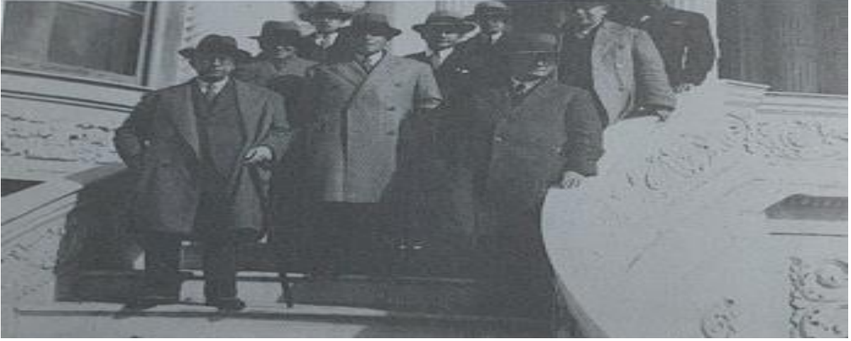
Kaynak : (“ Hocam” Maarif Vekili Esat SAGAY'ın Hatırları, 2012: 100)