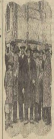
Maarif Vekili Ankara'da teği edilmiş.