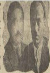
Şehir Meclisinde hatıra konuşu ve et mealesi üzerinde beyanatta bulunarlardan