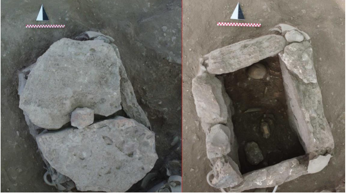
Resim 4: G74 numaralı taş sanduka mezar.

G97 numaralı taş sanduka mezar: Kuzeybatı-güneydoğu yönünde uzanan, 110 cm uzunluğunda ve 64 cm genişliğindeki dikdörtgen bir plana sahiptir. Mezarın doğu duvarı, tek parça kireçtaşı bir levha ile oluşturulmuşken, batı duvarını oluşturan diğer levha ise önceki kazı sezonlarında kaldırılmıştır. Mezarın kuzeybatı köşesinde burayı sınırlandıran kireçtaşı parçaları bulunmasına karşın, güneydoğu köşesi tahrip olmuştur. Mezar hediyesi olarak, açık bej renkli hamuru mineral ve taşçık katkılı, kırmızımsı kahverengi astarlı ve açkılı, hafif yükselen ağızlı tek kulplu bir testicik ele geçirilmiştir. Astarı içte ağız kenarı altın da bitmektedir (Resim 5.).