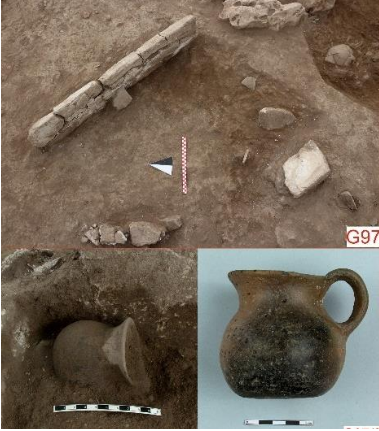
Resim 5: G97 numaralı taş sanduka mezar ve hediyesi.