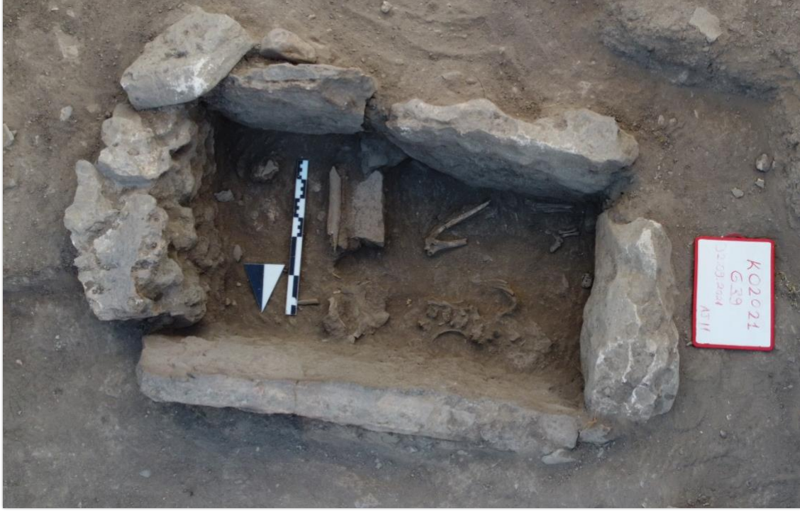
Resim 3: G39 numaralı taş sanduka mezar.

Mezar içerisinde, delikli bir seramik parça bulunmuştur. Bu parça, mezar hediyesi olarak değerlendirilebilir(Resim3).