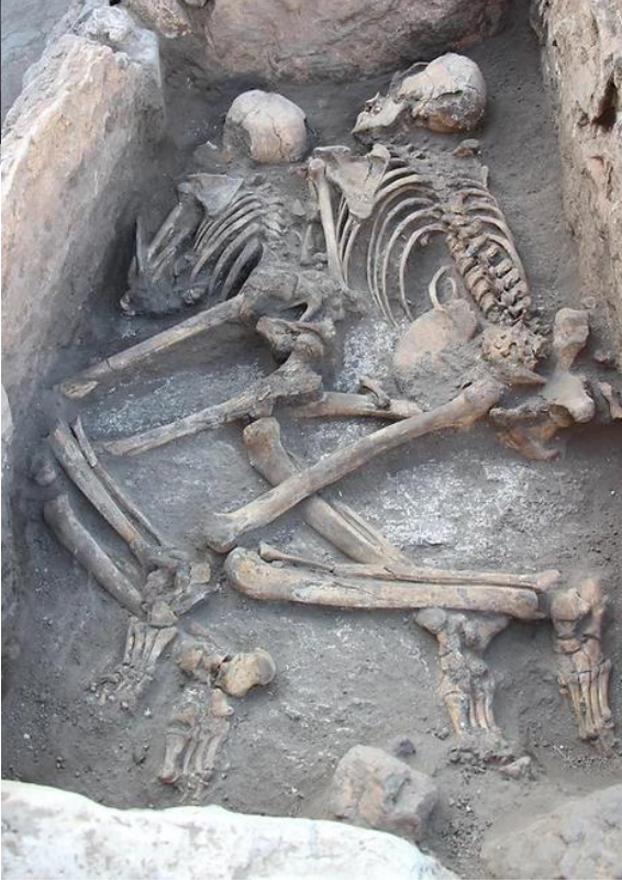
Resim 2: İskeletler üzerinde tespit edilen organik madde

G39 numaralı taş sanduka mezar: Mezarın kuzey duvarı, tek parça halinde işlenmiş büyük bir taş levha ile kapatılmıştır. Doğu ve batı duvarları ise daha kaba işlenmiş, daha küçük boyutlu taşlarla örülmüştür. Mezardaki iskelet kalıntıları, oldukça tahrip olmuş bir durumda bulunmuştur. İskelet çok fazla tahrip olduğu için bireyin cinsiyetinin belirlenmesini zorlaştırmıştır. Mevcut kemiklerin konumu ve dağılımı incelendiğinde, bireyin batı yönünde ve hocker veya yarı hocker pozisyonunda gömülmüş olduğu düşünülmektedir. Tek bir bireye ait olduğu tespit edilen bu gömü, inhumasyon yöntemiyle gerçekleştirilmiştir.