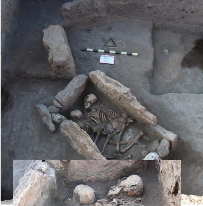
Resim 1: G3 Numaralı taş sanduka mezar.