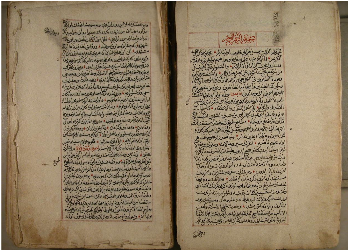
Muhammed bin Hüseyin'in Tercüme-i Nefehâtü'l-Üns'ün Mukaddime bölümü (vr.14b-1a)