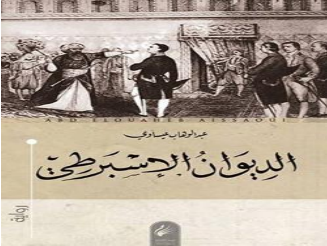
Şekil 1.1. Daru'l Mim Baskısı Kapak Resmi

Yukarıda ön kapak resimleri bulunan roman, tezimizin konusu olan ed-Dîvanu'l-Îsbartî'ye aittir. Bu baskı Daru'l-Mim tarafından 2018 yılında basılmıştır. Eser Uluslararası Arap romanı kurgu ödülünü almadan önceki baskısıdır. Kapak resminde 'yelpaze olayı' olarak bilenen Cezayir yöneticisi olan Hüseyin Dayı'nın Fransız konsolosa bayram sabahı bayramlaşma esnasında yaşanan tartışmayı resmetmektedir.