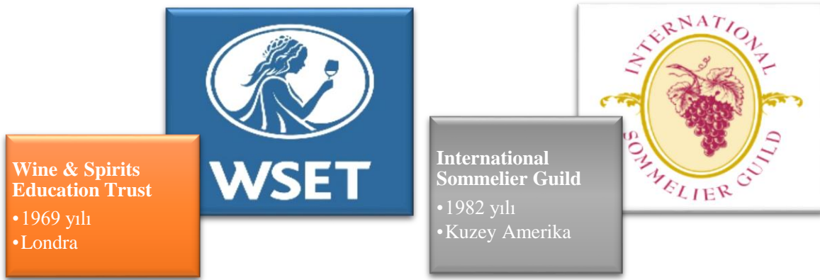
Şekil 1. Türkiye’de Şarap Profesyoneli Yetiştirmeye Yönelik Eğitimler Veren Uluslararası Kuruluşlar

WSET 1969 yılında Birleşik Krallık’ın şarap ve alkollü içkiler endüstrisinin artan eğitim ihtiyaçlarına hizmet etmek için kurulmuştur (WSET, 2022a). Merkezi Londra’da bulunan ve 50 yılı aşkın süredir eğitim faaliyetlerini sürdüren, bugüne kadar sektöre ilgi duyan veya sektör profesyoneli olan on binlerce kişiyi eğiten, dünyada şarap uzmanı yetiştirilmesi konusunda geniş bir ağa sahip en büyük kuruluş olma özelliğini taşımaktadır. WSET’nin eğitimcileri dünya çapında kabul görmekte, bilgileri ve verdikleri eğitimler devamlı denetlenmektedir. Tüm dünyaya yayılmış durumda eğitim ortakları olan WSET’nin müfredatı ve niteliklerinin oluşturulması, işlenmesi ve kalite güvencesinden kendileri sorumludur. Eğitim sağlayıcı ağında Türkiye’nin de dâhil olduğu 70’den fazla ülkede eğitim verilmektedir (WSET, 2022b). ISG ise 1982 yılında Kuzey Amerika’da doğmuş bir oluşumdur. Uluslararası Somelyer Derneği küresel ölçekte önoloji, somelyer, şarap işletmeciliği ve yönetimiyle ilgili çevrimiçi ya da yüz yüze standartlaştırılmış eğitim olanağı ve sertifikası sağlamaktadır. Tüm programlarının anlatım, tadım, inceleme ve sınavlardan oluşan bir yapısı vardır (International Sommelier Guild [ISG], 2020).