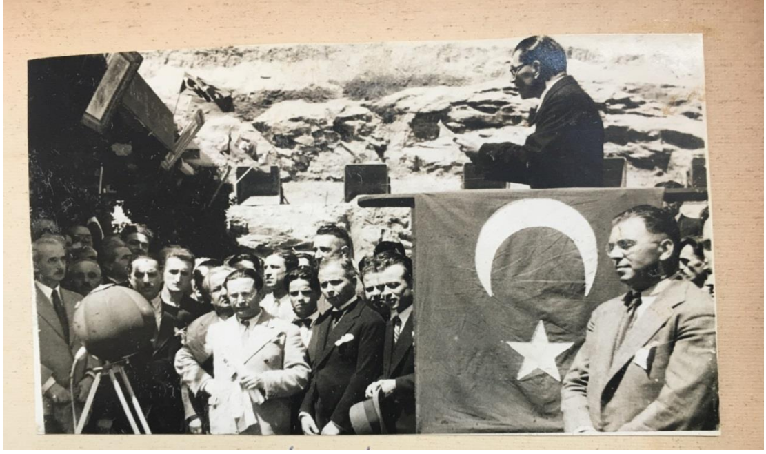
Başbakan İsmet İnönü'nün Anadolu seyahatlerinden