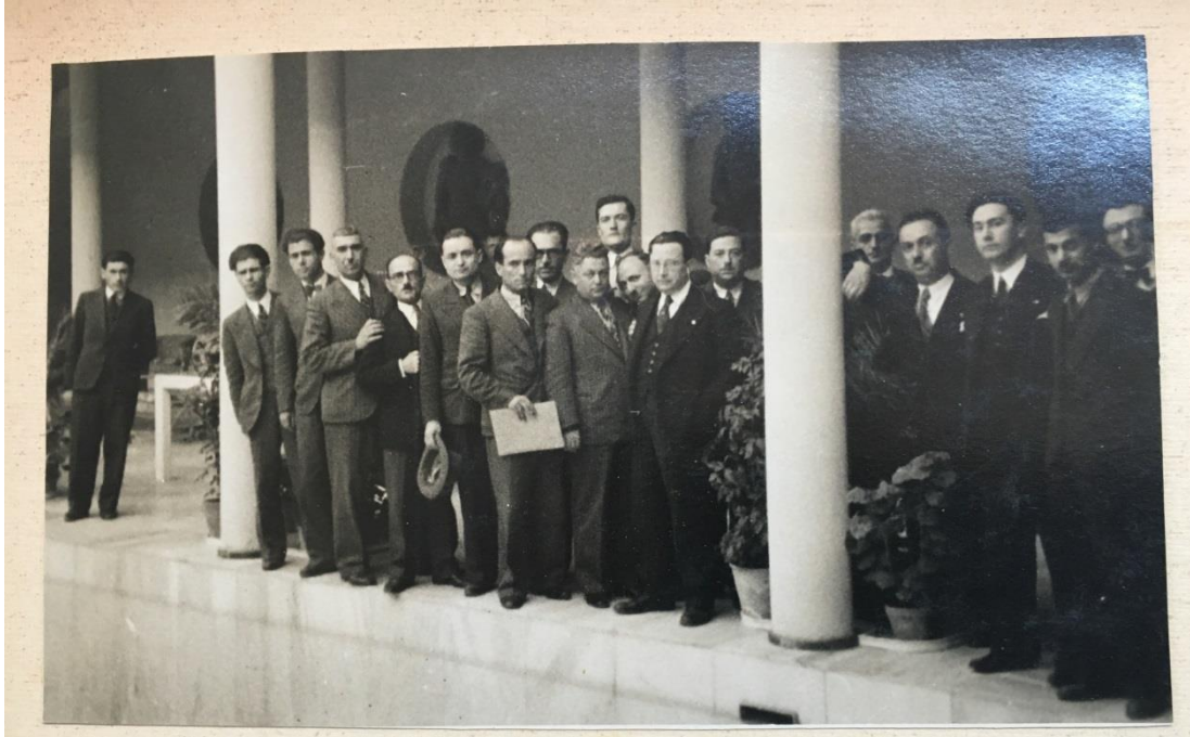
Basın kongresinden sonra Atatürk Köşkü gezisi.