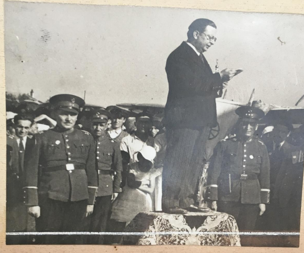
Refik Ahmet Sevgil milletvekili.