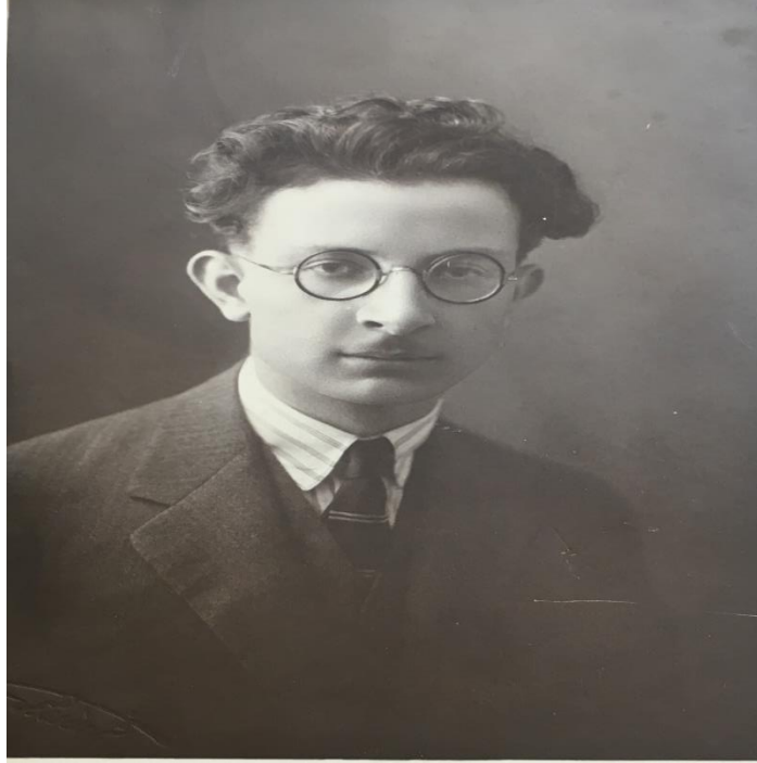
Refik Ahmet Sevengil (1921).