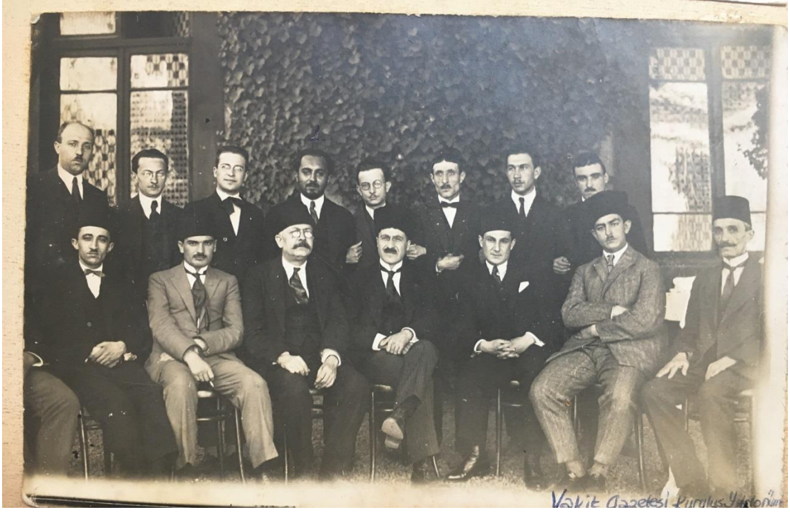
Vakit Gazetesi kuruluş yıldönümü