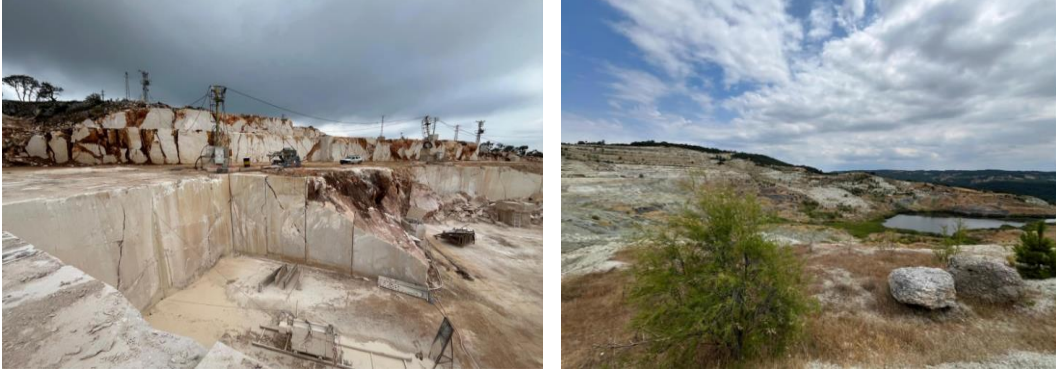
Foto 1. Nilüfer ilçesi çevresinde (2022) (sol) bulunan taş ocağı ile Keles ilçesi yakınlarındaki taş ocağı (2025) (sağ).