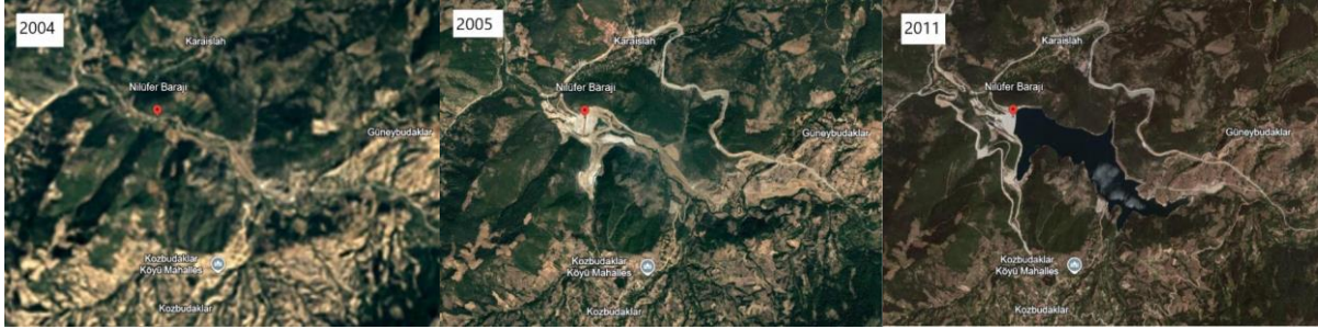
Şekil 2. Nilüfer barajının bulunduğu topografyanın yıllara göre değişimi. (2004-2005-2011)

Örneğin, 2004 yılına ait uydu görüntülerinde Nilüfer Barajı'nın bulunduğu alanda herhangi bir inşaat faaliyeti görülmemektedir. Ancak 2005 yılı görüntülerinde baraj inşaatının başladığı ve sahada küçük ölçekli antropojenik etkilerin ortaya çıktığı gözlenmektedir. 2011 yılına gelindiğinde ise barajın tamamlanması ve su tutmaya başlamasıyla baraj gerisinde yapay bir göl oluşmuş; böylece akarsu için yeni bir taban seviyesi belirlenmiştir. Bu durum, akarsu sisteminde erozyon, aşındırma ve biriktirme süreçlerinin yeniden şekillenmesine yol açarak bölgedeki jeomorfolojik dinamiklerde önemli değişimlere neden olmuştur (Şekil 2).