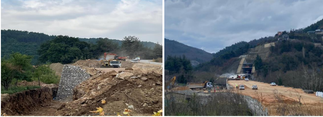
Foto 4. Bursa-Keles ilçesi yol genişletme çalışması (sol), Doğancı Tüneli yapım çalışması (2024) (sağ),

Örneğin, 2004 yılına ait uydu görüntülerinde Nilüfer Barajı'nın bulunduğu alanda herhangi bir inşaat faaliyeti görülmemektedir. Ancak 2005 yılı görüntülerinde baraj inşaatının başladığı ve sahada küçük ölçekli antropojenik etkilerin ortaya çıktığı gözlenmektedir. 2011 yılına gelindiğinde ise barajın tamamlanması ve su tutmaya başlamasıyla baraj gerisinde yapay bir göl oluşmuş; böylece akarsu için yeni bir taban seviyesi belirlenmiştir. Bu durum, akarsu sisteminde erozyon, aşındırma ve biriktirme süreçlerinin yeniden şekillenmesine yol açarak bölgedeki jeomorfolojik dinamiklerde önemli değişimlere neden olmuştur (Şekil 2).