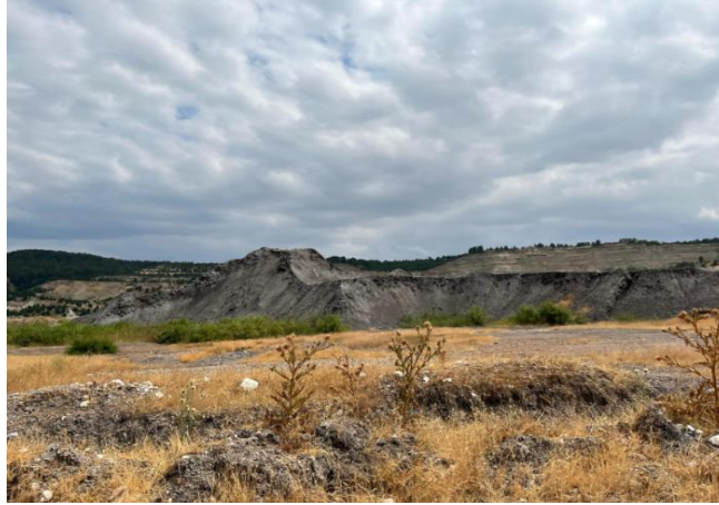
Foto 2. Maden alanından çıkarılan hafriyatın üst üste biriktirilmesiyle oluşan tepeler.

Malzeme depolanması, özellikle dolgu alanları ve hafriyat birikimleriyle arazi şekillerinin belirgin biçimde değişmesine neden olmaktadır. Maden işletmelerinden çıkan atıkların yığılması, yol ve yapı inşaatlarında kullanılan malzemelerin depolanması ile çöp depolama sahaları, topoğrafya üzerinde düzensiz biçimli yeni şekiller oluşturabilmektedir (Foto 2).