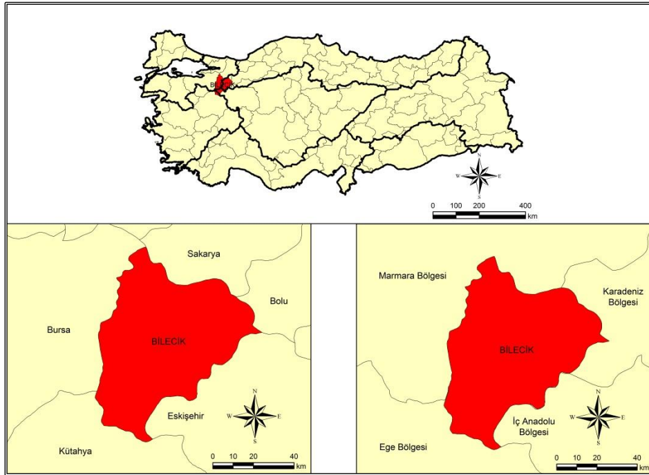
Şekil 2: Bilecik İli Lokasyon Haritası

Bilecik ili, Marmara Bölgesi'nin güneydoğu kesiminde; Marmara, Karadeniz, İç Anadolu ve Ege Bölgelerinin kesiştiği bir alan üzerinde yer almaktadır. Bu özelliği ile Türkiye'de dört bölgede toprakları olan tek il durumundadır. Doğuda Bolu ve Eskişehir, batıda Bursa, güneyde Kütahya, kuzeyde ise Sakarya illeri ile çevrilidir (Şekil 2).