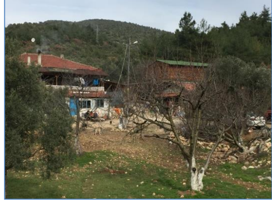
Fotoğraf 3: Bilecik-Gölpazarı Yolu Üzerinde Bulunan Zeytinliboğaz Çiftliği