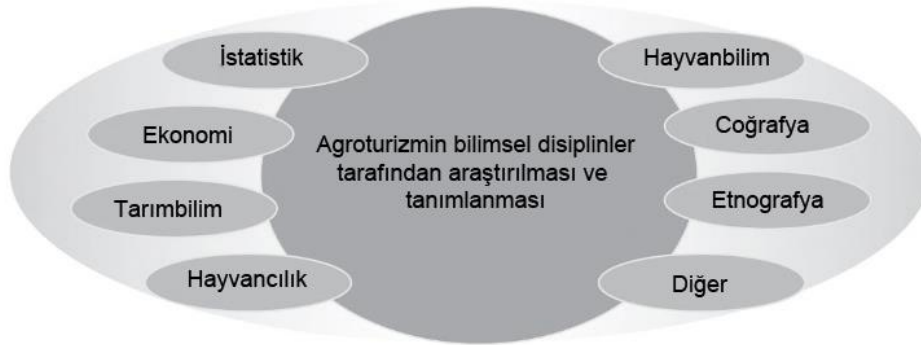
Şekil 1: Agro-turizmin Multidisipliner Karakteri

Son yıllarda agro-turizm konusunda hem dünyada hem de Türkiye'de farklı bilim disiplinleri tarafından yapılan çalışmalar artmıştır. İlgili çalışmalar Özşahin ve Kaymaz tarafından ana başlıklar olarak gruplandırılarak özetlenmiştir (Özşahin ve Kaymaz, 2014: 243). Aşağıda verilen şekil bu durumu açıkça ortaya koymaktadır (Şekil 1).