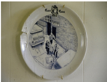
Görsel 3. Charles Krafft, Afet Tabakları-Wah Mee Club Katliamı, Restoran tabağı üzerine fırça dekor, 1992 http://www.charleskrafft.com/plates/attachment/00730047/

“Tabaklar uzun süredir politik ve kan dondurucu olayları tasvir etmektedir” (Scott, 2001: 144). “İçerik ve kültür ile zor, huzursuz oyunlar oynayan ABD’nin en baştan çıkarıcı sanatçılarından biri olan Charles Krafft” (Vecchio; 2001: 112) da tabaklarında kan dondurucu olayları zarif mavi beyaz dille anlatmaktan çekinmemektedir. Krafft doksanların başından itibaren Afet Tabakları ( Disasterwares ) adını verdiği serisinde; Delft’in mavi beyaz geleneğini kullanarak bir dizi doğal ve sosyo-politik felaketi buluntu ve çoğu logolu restoran tabaklarının üzerine resmetmiştir 1 . Krafft’ın Afet Tabakları Serisi’nde resmettiği konular arasında; Çöl Fırtınası, İkinci Dünya Savaşı’nda Dresden’in Bombalanması, Sirk Yangını, 1990 Fir Adası Seli, Wah Mee Katliamı (Görsel 3), Atom Bombası, Yangındaki Türk Polisi sayılabilir. Krafft Afet Tabakları ile yaptığı şeyi; “saf kitsch, ucuz bir hediyelik eşya. Bu kaykay tasarımı ve Pop Art gibi Low Art (Alçak Sanat). İnsanlara ulaşmayan soyut sanat gibi yüksek değil” (Scott, 2001: 144) diyerek açıklamaktadır.