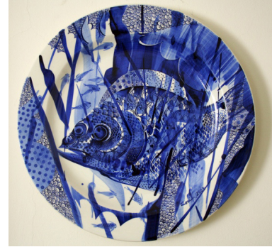
Görsel 24. Semih Kaplan, İsimsiz, Çini üzerine sıraltı kobalt, 2008 http://galerisoyut.com.tr/semih-kaplan-2009/#gorsel-1/4/sk0903-05.jpg

Geleneksel Türk çini sanatının sahip olduğu ifade dilini bir malzeme olarak kabul eden ve son dönem Çağdaş Türk Seramik Sanatçıları arasında gelenekle çağdaş arasında kurduğu köprüyle dikkat çeken Semih Kaplan, mavi beyaz çini tabaklarında geleneğin malzemesine karşı tutunduğu yenilikçi tavrı ve önerileriyle çini sanatını ileriye taşımaya çalışmıştır. Semih Kaplan geleneksel çininin ifade dilinin “çağdaş yaklaşımlarla yeniden yorumlanmasında, çeşitli resim teknikleri ile çiniyi buluşturarak elde edilecek sentezin, ifadenin sonsuz olasılıklarla çoğaltılmasında yenilikçi bir yaklaşım” (Kaplan, 2017: 1113) olarak görür.