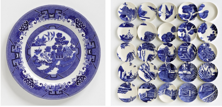
Görsel 15. Hatch'in kişisel koleksiyonundan antika tabak.

Yemek tabaklarının fonksiyonel “yüzeylerini hem konusu hem de tuval olarak kullanan” (Hatch, 2018) Amerikalı Molly C. Hatch eski ve yeni arasındaki diyaloga tutkun bir sanatçıdır. 18. ve 19 yüzyıla ait aile yadigarı değerli antikalara kendine kaynak olarak kullanan Hatch (Görsel 15), Mavi Söğüt Moti ( Blue Willow ) (Görsel 16) adlı eserinde, aile koleksiyonuna ait Söğüt Moti bir tabağı, birbirine bitişik olarak yerleştirilmiş 25 adet seramik tabağın içine fırça ile sıraltı dekoru uygulayarak büyütmüş kendi mavi beyazlarını yaratmıştır.