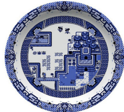
Görsel 13. Caroline Slotte, Katlı Peyzaj, İkinci el tabaklara elmas uçlu el frezesi ile müdahale, 2012 http://carolineslotte.com/works/landscape-multiple/

Klasik Söğüt Moti yüzyıllardır Avrupa sofralarının en bilinen desenidir. Avrupa'da hala pek çok ailede iyi korunmuş mavi beyazların bulunmasının bir nedeni kuşkusuz bu tabakların kullanılmaya kıyılmayacak kadar çok sevilmesi ve daha çok vitrin objesi olarak yıllarca sergilenmesiyle ilgilidir. İngiltere Winchester'da bulunan bir grak tasarımcı olan Olly Moss, Söğüt Moti'ni kullanarak ürettiği 8-bitlik Söğüt Moti ( 8-bit Willow Pattern ) adlı yemek tabaklarında Söğüt Moti'ni oluşturan detayları, "Nintendo'nun The Legend of Zelda ve Pokémon oyunlarından esinlenerek tasarlamış ve tabakları video oyun sanatını sergilemek için uygun bir platform olarak görmüştür" (Baseel, 2015). Olly Moss'un 8 bitlik Söğüt Moti (Görsel 14) tabakları, ilk bakıldığında vitrinden çıkmış bir mavi beyaz porselen gibi algılanmasına rağmen Moss; tabağın içindeki Game Boy klasiklerinin ekran görüntüsüyle, klasik Söğüt Moti'ni kaynaştırarak iki klasiği birleştirmeyi başarmıştır.