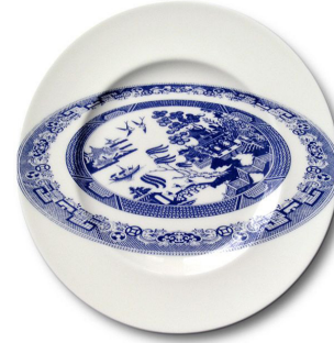
Görsel 6. Robert Dawson, Perspektifteki Söğüt Motifi-1, Porselen üzerine çıkartma dekor, 1996 http://louisabarfoot.blogspot.com/2011/04/robert-dawson.html

ve bükmeyle oluşturduğu serileriyle tanınırlık kazanmıştır. Robert Dawson 1996 yılında, iyi bilinen Perspektifteki Söğüt Motifi ( In Perspective Willow ) (Görsel 6) adlı eserinde, geleneksel Söğüt Motifi'nin perspektifin bozarak ve onu göz seviyesinde görülebilecek bir açıyla basar. Bu açı, tabağın bütünlüğü içinde optik bir yanılsama hissini ve desenin etkisini çarpıcı biçimde artırır. Dawson'ın hazır sırlı porselen tabaklar üzerine yaptığı; "nazik yıkımlar, genellikle topyekûn bir savaş gibi görünür, geleneksel dekoratif desenlerin kolay bilinirliklerine yapılmış bir saldırıdır... Bu yaklaşım, Dawson'ın web sitesinin adıyla özetlenebilir: estetik sabotaj" (Terkaoui, Reder, McHugh, 2007: 190).