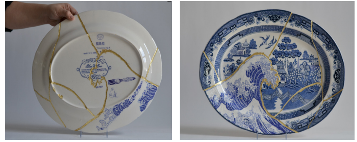
Görsel 9-10. Paul Scott, Fukushima, 1965 tarihli kırık tabak üzerine müdahale ve kintsugi, 2014 http://cumbrianblues.com/portfolio/page/3/

2011 yılında Japonya'da meydana gelen 9.0 büyüklüğündeki deprem ve onun ardından gelen tsunami sonucu, Fukushima şehrinde bulunan Fukushima Nükleer Santrali'nde, 1986 Çernobil'den sonra dünyada meydana gelen en büyük nükleer kaza haberi de Paul Scott tarafından esere dönüştürülmüştür. Scott bu kazayı ve yaşanan dramı 2014 yılında biçimlendirdiği Fukushima adlı eserinde; ebay'den satın almış ve kendisine kırık ulaşmış 1965 Japonya yapımı (Görsel 9) Söğüt Motifli mavi beyaz tabağı kullanarak yorumlamıştır (Görsel 10). Söğüt Motifli kırık tabağın merkezine doğru saldıran dalganın olduğu kırığı öncelikle eski deseninden arındırmış daha sonra mavi beyaz dalga desenini yeniden o kırık parçanın üzerine aktarmış, fırınlamış ve daha sonra tüm tabağı 15. yüzyılın sonlarına doğru Japonya'da geliştirilen tamir sanatı kintsugiyi kullanarak reçine, çimento ve altın ile bütünleyerek kolajını tamamlamıştır.