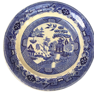
Görsel 4. İngiltere’den Söğüt Motifli Tabak, 1800’ler, Scott, 2015: 69

geleneksel kuralları kırmıştır. Kottler’in yaptığı tek şey hazır çıkartma dekorlarını değiştirerek tabak formatına uyarlamaktır” (Bull, 2015: 41). Kottler’in eserlerinde kullandığı indirek transfer baskı: çıkartma yöntemi “seramik sanayisinde ilk defa İngiliz firma Johnson Matthey tarafından 1954-55 yıllarında kullanılmıştır” (Hakan Verdu Martinez 2012: 40). Ancak konuyla ilgili çalışmalar Sanayi Devri İngiltere’sinin ciddi uğraş konusu olmuş, başlangıçta bakır plakalara yedirilen boyalarla yapılan “transfer baskı prosesi, 1750 dolaylarında, kuvvetle muhtemelen İngiltere’de icat edilmiştir... Böylelikle albenili Çin porselenlerini süratle taklit etmenin de yolu açılmış” (Yılmaz, 2012: 93), Batı’da Çin etkilerine göndermeler yapan Chinoserie denilen stil gelişmeye başlamış olur.