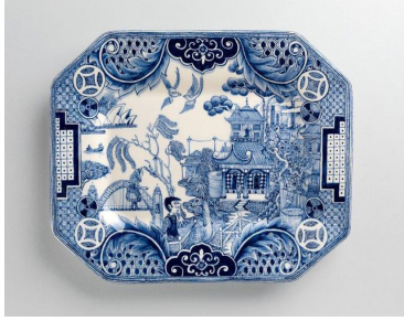
Görsel 11. Stephen Bowers, Avustralyalı Söğüt Motifi, Fırça dekorlu mavi beyaz porselen tabak, 2013 Scott, 2015: 71

Alice bulunmakta, onun önünde Avustralya'nın ünlü çizgi film karakteri Boofhead görülmektedir. Dünyanın en büyük uranyum üreticilerinden olan Avustralya'da nükleer santral inşasıyla ilgili yapılan tartışmalar tabağı çevreleyen radyoaktif uyarı sembollerinden anlaşılabilir ve son olarak Söğüt Moti'ndeki çay evi fast food restoranına çevrilmiştir.