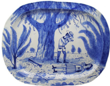
Görsel 22. Stephen Bird, Vicdan Azabı, 2012 https://www.olsengallery.com/blog/stephen-bird-national-museum-of-decorative-arts-and-design-oslo/

yüzyılda yoğun biçimde çalışan fabrikaların seri üretim yaptığı süs ve hediyelik eşyalarını garip bir biçimde yeniden yorumladığı mavi beyaz tabaklara fırça dekoruyla yaptığı şey “görgü kuralları ve formaliteyi neşe içinde yıkmayı içerir. İşlediği konular-korkunç cinayet sahneleri, hayvan gaddarlığı, parçalanmış vücut parçaları ve seks dahil günahsı bir tadı açığa çıkarır” (Wearn, 2018). Vicdan Azabı ( Remorse ) (Görsel 22) adlı mavi beyaz tabağında; kadın düşmanlığını konu alır. Bu tabakta kadını vuran “adam gözbebeklerini yuvalarından çıkartır ve gözleri avuç içlerinden ona bakmaktadır. Tüm bu sembolik görseller William Tell /William Burroughs ve King Lear/Oedipus Rex’in hikayelerinde kullanılan metaforlardır. Sonunda adam pervasız geçmişine bakar” (Woodford, 2013: 44).