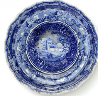
Görsel 13. Caroline Slotte, Katlı Peyzaj, İkinci el tabaklara elmas uçlu el frezesi ile müdahale, 2012 http://carolineslotte.com/works/landscape-multiple/

resimlerini su jeti, elmas uçlu el frezesi ve zımparalama başlıkları yardımıyla kesip çıkartarak elde ettiği çok yoğun derinlik hissi oluşturan mavi beyaz Katlı Peyzaj ( Landscape Multiple ) (Görsel 13) tabakları bulunmaktadır. "Bu çalışma süreci, malzemeyi sorgulama ve nesnedeki hikâyeleri vurgulama yoluyla biçime" (K-verdi, 2010) dönüştürmeyi içerir. Slotte bu tabakların yüzeylerine "o kadar detaylı ziksel müdahalelerde bulunur ki bu durum eseri asla göremeyeceğimiz biçimde görmemizi sağlamaktadır" (Jobson, 2014).