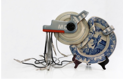
Görsel 19. Brendan Tang, Manga Ormolu Ver. 4.0-w, Elle biçimlendirme fırça dekor, 2016 http://www.brendantang.com/work-1/#/new-gallery-5/

16. yüzyılın sonlarından başlayarak Avrupa aristokrasisine Çin'den Avrupa'ya gelen porselenleri daha cazip hale getirebilmek için, yarı değerli veya değerli metal parçalarıyla yapılan geleneksel aplike işlemine ormolu denir. Ormolu Porselenler kısaca doğu batı sentezi porselen üretimine verilen isimdir. Eserlerinde ormolu porselenlerden feyz alan Kanadalı sanatçı Brendan Tang, Manga Ormolu Ver. 4.0-w (Görsel 19) adlı serisinde biçimlendirdiği Çin porselenlerini "fütüristtik robotik protezlerle savaşıyormuş gibi göstermektedir" (Dymond, 2010).