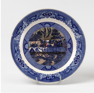
Görsel 5. Howard Kottler, Mavi Söğüt Motifi-Son Akşam Yemeği, Çıkartma dekor, 1969 Scott, 2015: 82

çok yorumlanan motif olduğu görülür. Kuşkusuz bunda motifin Doğulu gözükmeye rağmen Batı aklının eseri olması, taklit olmasına rağmen taklit edilmesi, ülkelere göre değişen yorumlarının bulunması, endüstriyel üretimin batı kültürüne ait önemli bir sembolik değeri olması gibi noktalar etkili olmuştur. "Amerikalı sanatçı Howard Kottler'ın, 1967 yılında ürettiği Mavi Söğüt Motifi-Son Akşam Yemeği ( Blue Willow- Last Supper ) (Görsel 5) adlı tabağı, muhtemelen Söğüt Motifi'nin çağdaş sanatta kullanılan en eski örneğidir" (Voile, 2015: 32).