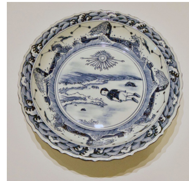
Görsel 2. Ai Weiwei, Odyseia Serisi-Aylan Kurdi , Fırça dekorlu mavi beyaz porselen tabak, 2017

Ai Weiwei 2016 yılında Türkiye’ye mülteci kamplarını ziyaret etmek için gelir. Daha sonra İstanbul’da İslam Eserleri Müzesini gezerken bir Çin porseleninin Osmanlı zanaatı ile buluşmasıyla ortaya çıkan eseri görür ve fik en 2017 yılının Eylül ayında İstanbul Sakıp Sabancı Müzesi’nde gerçekleştirdiği “Porselene Dair” adlı sergisinin ilk kıvılcımı böylece ateşlenmiş olur 1 . Bu sergi için özel olarak sıraltı fırça dekoru uygulayarak ürettiği/ürettirdiği Odyseia ( Odyssey ) adlı mavi beyaz porselen seri tabakların merkezinde sığınmacı kamplarını, mültecilerin yaşadığı zulmü, şiddeti, çatışmaları, bir kamyonla doğduğu topraklardan kaçanları, harabeye dönen kentleri, göçü, denizi geçme fikrini, dalgaları, dalgaların yuttuğu ve sonra da kıyıya bıraktığı Aylan Kurdi’nin cansız bedenini (Görsel 2); internetten edindiği fotoğrafla dan esinlenerek betimlemiştir. Tabaklarının bordüründe kullandığı bezemeler; dertlerini anlattığı insanları çevreleyen silahlar, tel örgüler ve dalgalara ait çağdaş görüntülerden oluşmuştur.