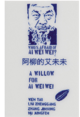
Görsel 7-8. Paul Scott, Ai Weiwei için bir Söğüt Motifi, 1840 tarihli tabak üzerine müdahale, 1991 http://cumbrianblues.com/portfolio/page/3/