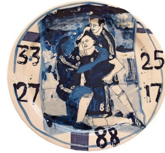
Görsel 21. Philip Eglin, Lampard'ın Ağzı, Sıraltı fırça dekor, 2011 http://www.philipeglin.com/work/#/plates/

"Önceleri Dada etkisiyle, 1950'lerden sonra da Funk hareketiyle, seramik sanatında savaş karşıtı, çevre sorunlarını irdeleyen, ırk, cinsiyet, politik ve güncel konuları ele alan birçok eser üretilmiş, yayınlar yapılmış, sergiler açılmıştır" (Anılanmert, 2017: 12). Hollanda Sokak Sanatı'nın öncüsü Hugo Kaagman, Delft'in ünlü mavi beyaz geleneğini ve motieri topluma ait çağdaş görüntülerle birleştirerek kendi politik söylevini, punk tarzında hazırladığı şablonları kullanarak aktarmaktadır (Görsel 20). Kaagman'ın geleneği modernize eden anlatım diliyle; resimden seramiğe; giysilerden duvarlara, tünellerden kulelere, otobüslerden teknelere, trenlerden uçaklara kadar uzanan geniş perspektiyle çalışmaya devam etmektedir. Alaycı ve eleştirel olan eserleri aynı zamanda gelenekseldir ve Kaagman eserlerini "şoke mavisi" olarak tarif eder.