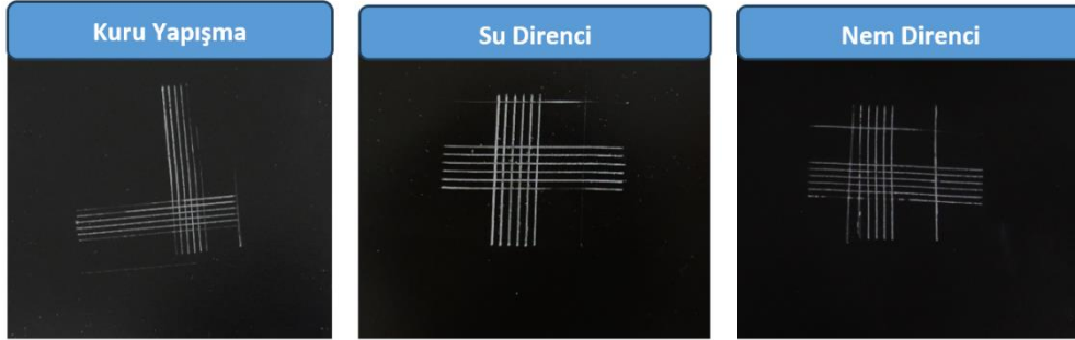
Şekil 2: %1 Konsantrasyonda EcoAL 20A kullanılarak 60 sn’de gerçekleştirilen Chrome Free ön işlemi ile gerçekleştirilen kataforez kaplamaların kuru yapışma, su ve nem direnci sonrası Cross Cut görüntüleri

Şekil 2’te ön işlem olarak 60 sn süre ile uygulanan Chrome Free sonrası üretilen kataforez kaplamaların kuru yapışma, su ve nem direnci sonrası yapılan yapışma testleri sunulmuştur. Tüm test sonuçları incelendiğinde Alüminyum alaşımına uygulanan Chrome Free yüzey hazırlığının etkili olduğu görülmektedir.