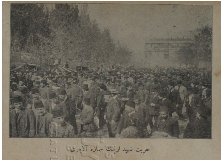
Resim 10: Hürriyet şehitlerinin cenaze alayları