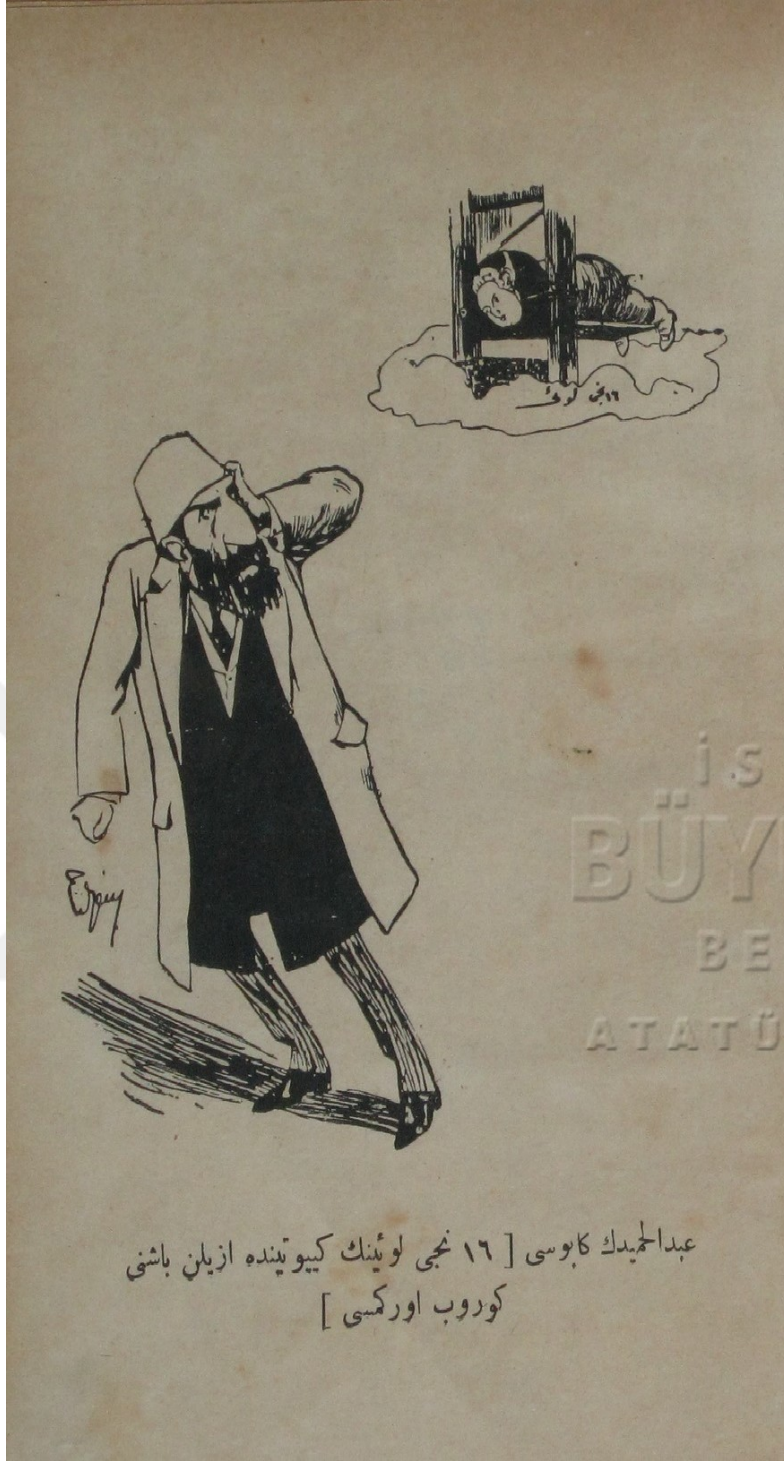
Resim 12: Abdülhamit'in kâbusu (12 inci Louis'in giyotinde ezilen başını görüp ürkmesi)