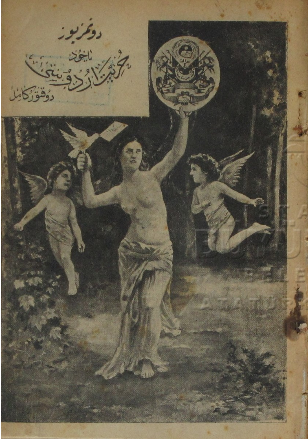
Resim 1: Dönmez Yüz yahut Hürriyet Ordusu adlı oyunun iç kapağı: Perî-i Hürriyet

Kaynak: Doktor Kâmil, Dönmez Yüz yahut Hürriyet Ordusu.