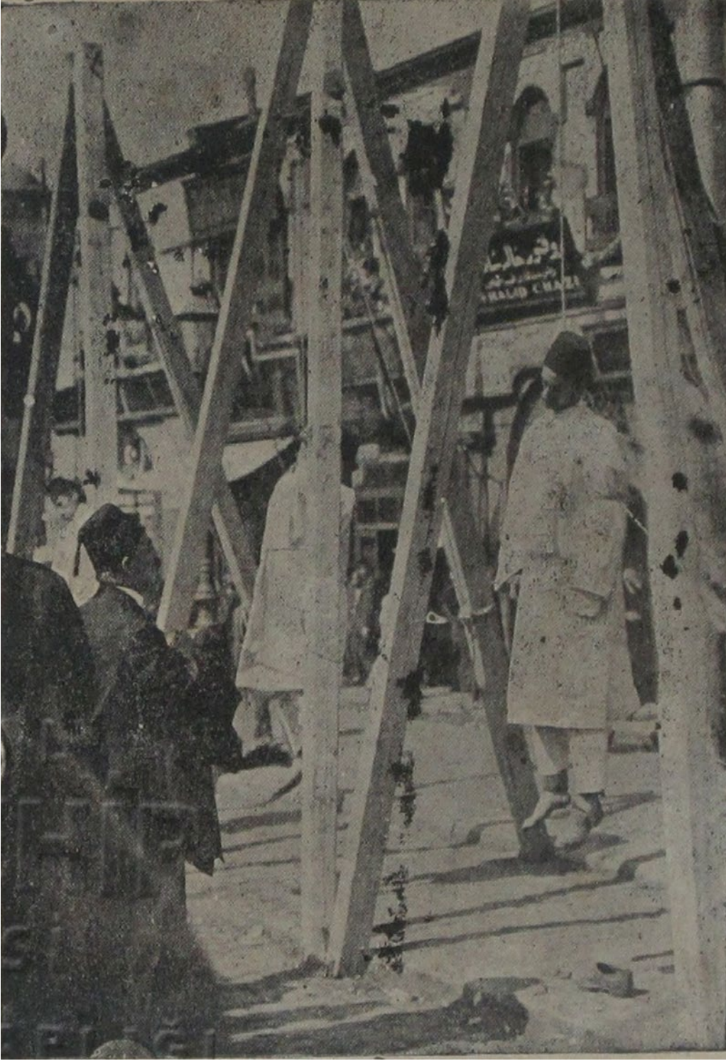
Resim 11: 31 Mart ihtilalcilerinin Divan-ı Harb örfi kararı ile salben idamları

Kaynak: Doktor Kâmil, Dönmez Yüz yahut Hürriyet Ordusu.