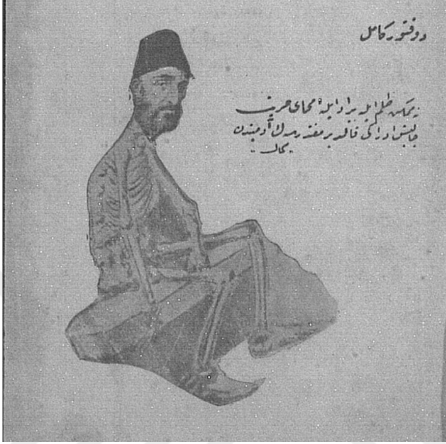
Resim 13: Canlı Cenaze yahut Yıldız'da Meşrutiyet Telaşları adlı oyunun kitap kapağında II. Abdülhamit'i temsil eden bir karikatür.

Karikatürün yanında Namık Kemal'in bir beyti: