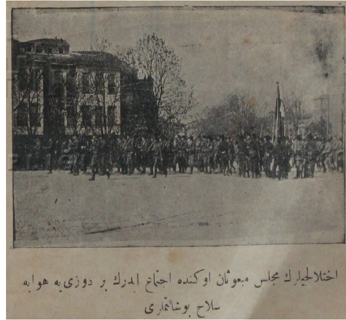
Resim 3: İhtilalcilerin Meclis-i Meb'usan önünde ictima' ederek bir düziye havaya silah boşaltmaları