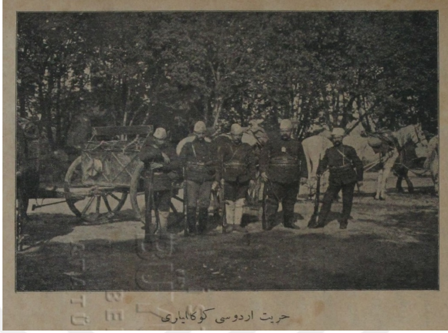
Resim 4: Hürriyet Ordusu gönüllüleri

Kaynak: Doktor Kâmil, Dönmez Yüz yahut Hürriyet Ordusu.