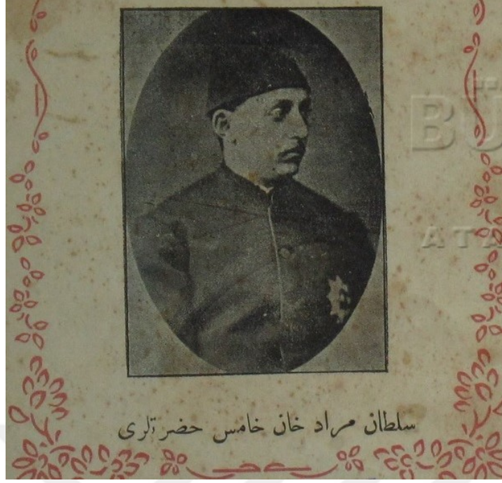
Resim 14: Sultan Murad Han-ı Hâmis Hazretleri