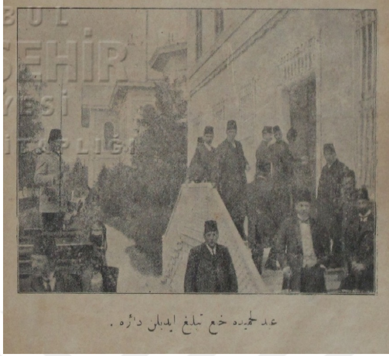
Resim 9: Abdülhamid'e hal tebliğ edilen daire.