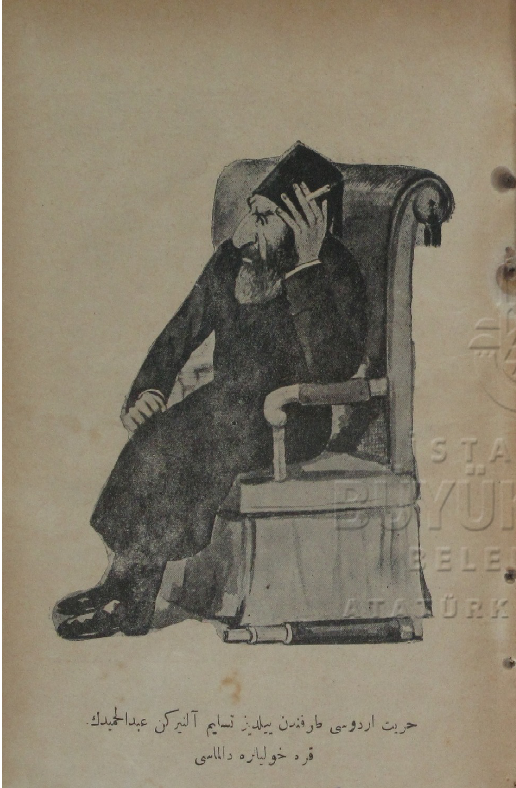
Resim 8: Hürriyet Ordusu tarafından Yıldız teslim alınırken Abdülhamit'in kara hüyalara dalması

Kaynak: Doktor Kâmil, Dönmez Yüz yahut Hürriyet Ordusu.