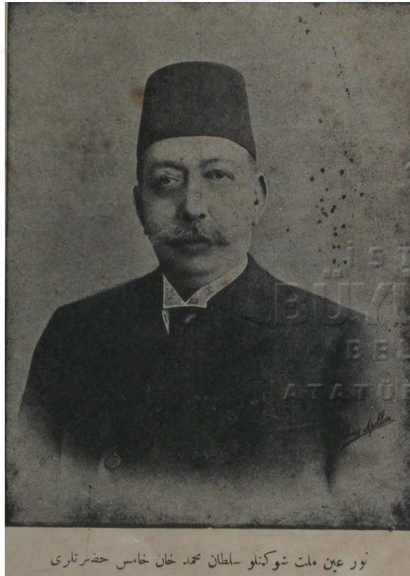
Resim 15: Nur-ı ayn-ı millet şevketli Sultan Mehmed Han-ı Hâmis Hazretleri