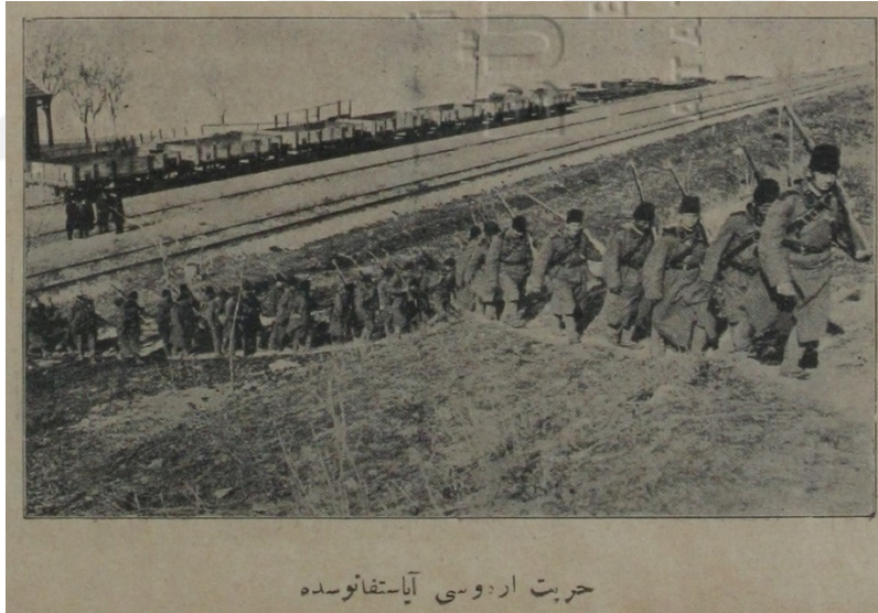
Resim 7: Hürriyet Ordusu Ayastefanos'ta