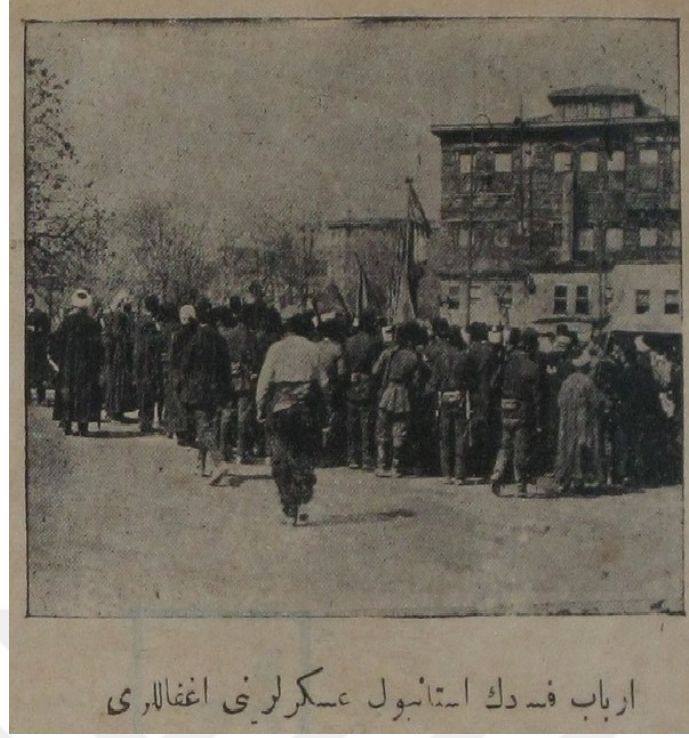
Resim 2: Erbab-ı fesadın İstanbul askerlerini iğfalleri