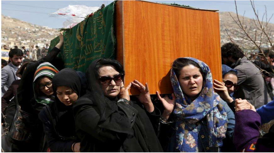
Resim 8: Farkhunda Malikzade'nin tabutu Afgan Kadınlar tarafından taşınıyor 2015.

Malikzade'nin vücutu linçten üç gün sonra tabuta alındığında cenazesinde sadece kadınlar tarafından taşınmıştır. Çok sayıda gazeteci ve aktivist tarafından cinsiyete dayalı şiddete karşı kadınların dayanışma anı olarak görülen cenaze adeta bir geleneğin başlangıcı kabul edilmiştir. Bu aktivistler, birçok suçtan beraat eden polis memurlarına ve diğer suçlulara verilen hafif cezalara ve katillerin çoğunun hala cezalandırılmamış olmasına da tepki göstermişlerdir.