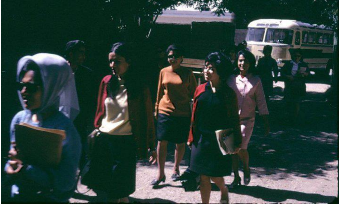
Resim 2: 1967'de üniversiteye giden Afgan kadınları

1961 yılında kadınlar Kabil Üniversitesi'ne kabul edilmeye başlanmıştır. Eğitim sistemi seküler hale getirilmiştir. Bunun yanı sıra kadınlar giyim konusunda serbest bırakılmıştır. Burka isteğe bağlı bir hal almıştır. Kadınlar resmi törenlere batılı kıyafetlerle katılmaya başlamışlardır (Sivrioğlu ve Türkoğlu, 2017: 240).