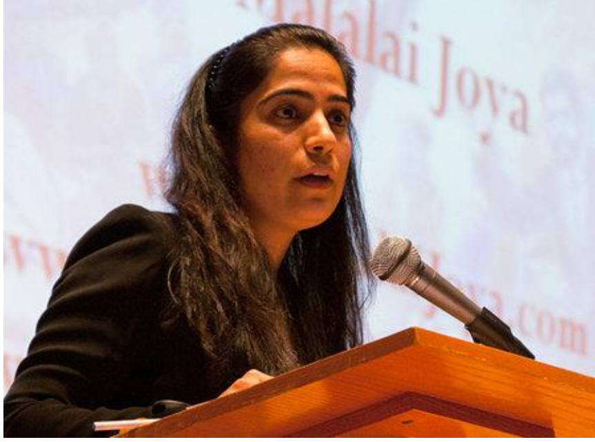
Resim 4: Malalai Joya