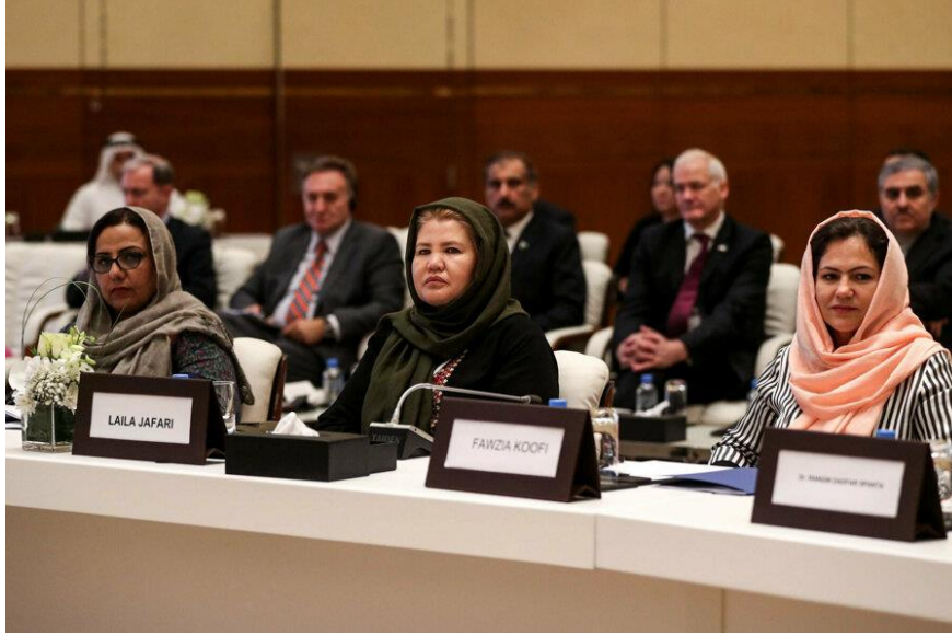
Resim 3: Fawzia Koofi Taliban Görüşmelerinde

Afganistan tarihinde bir köşe taşı olarak yerini almış olan Fawzia Koofi, bir politikacı, parlamento üyesi ve kadın hakları savunucusu olmasının yanı sıra Taliban ile müzakereye oturmuş olması nedeniyle de adından oldukça söz ettirmiştir. Aslında doğduğu an hayat ile mücadelesi başlayan Koofi kaleme aldığı “The Favored Daughter: One Woman's Fight to Lead Afghanistan into the Future” adlı eserinde, mücadele ve başarı timsali olan hayat hikayesini anlatmıştır.