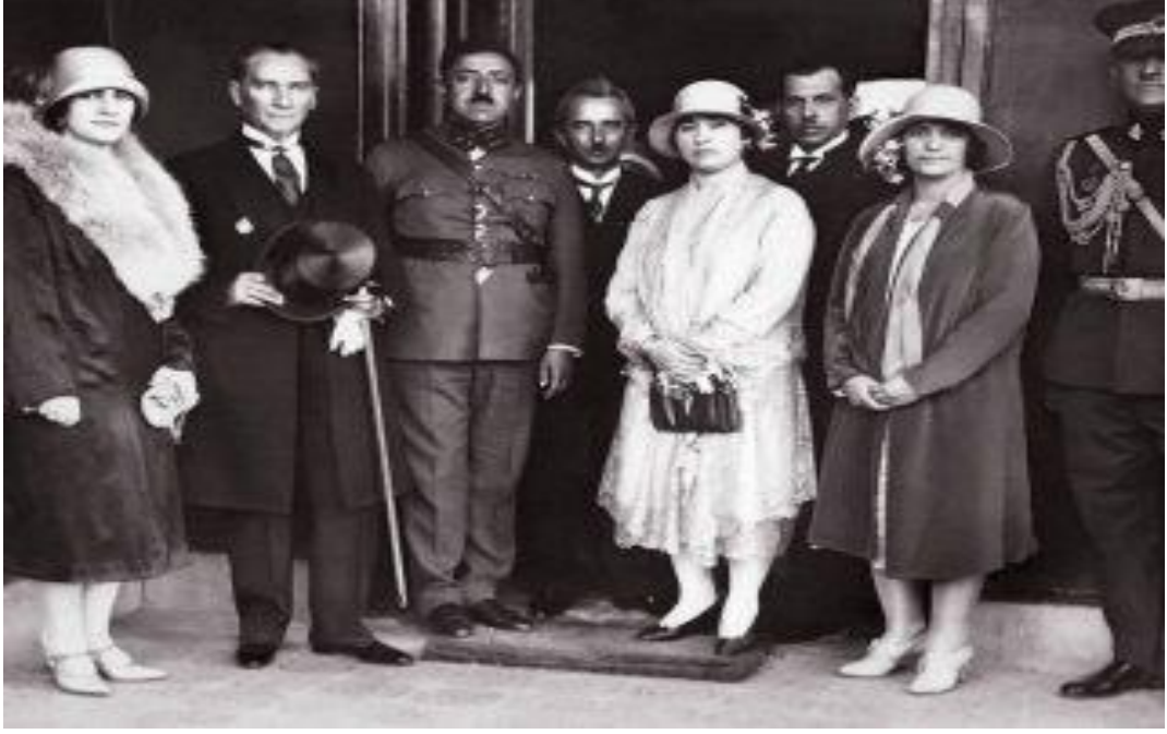
Resim 1: Kral Amanullah ve Kraliçe Süreyya Atatürk'ün konuğu olarak Ankara'da.

Afganistan'a uygulamak istemiştir. Bunlardan en önemlileri eğitim alanında olanlardır. 1928 yılında yaptığı Avrupa gezisi neticesinde Türkiye'ye gelen Kral ve eşi aynı zamanda yeni Türkiye'nin ilk resmi konuğu olma unvanını taşımaktaydı. Atatürk'ün inkılaplarından çok etkilenen Kral, ondan tavsiyeler aldıktan sonra dostluk anlaşmasını imzalamıştır (Yılmaz, 2010: 163).