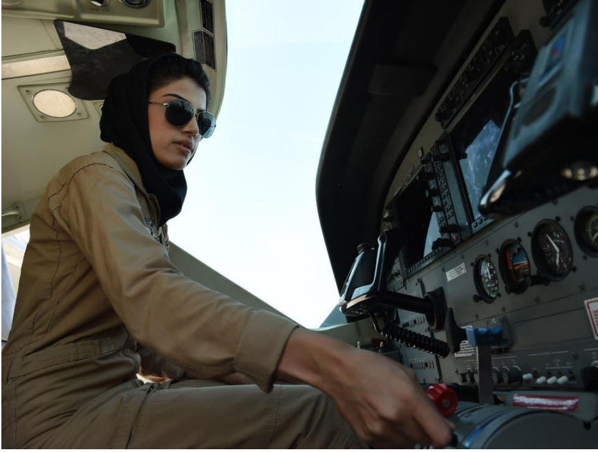
Resim 7: Niloofar Rahmani

katılmaları için işe alım duyurusu yapmasıyla başlamıştır. Rahmani uçuş okulundan mezun olduktan sonra engelleri zorlamaya devam etmiş ve ileri uçuş eğitiminden geçmeyi başarmıştır. Bu başarı örnekleri, Afganistan'daki genç nesil için rol model olmasını sağlamıştır (Runion, 2017: 220) Böylelikle 1992 yılında doğmuş olan ve genç yaşında çok sayıda başarının altında imzası bulunan Rahmani, Afganistan kadınlarının tarihine gelecek nesil için bir cesaret örneği olarak geçmiştir.