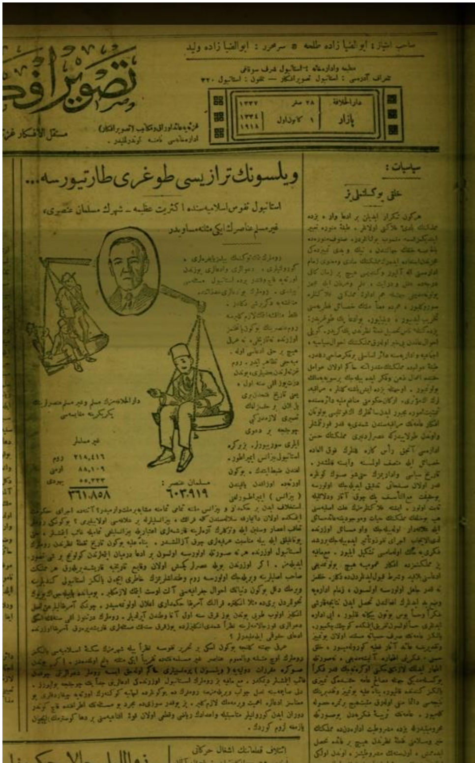
Tasvir-i Efkar, "Wilson'un Terazisi Dogru Tartiyorsa.."1. Aralık. 1918,s.1.