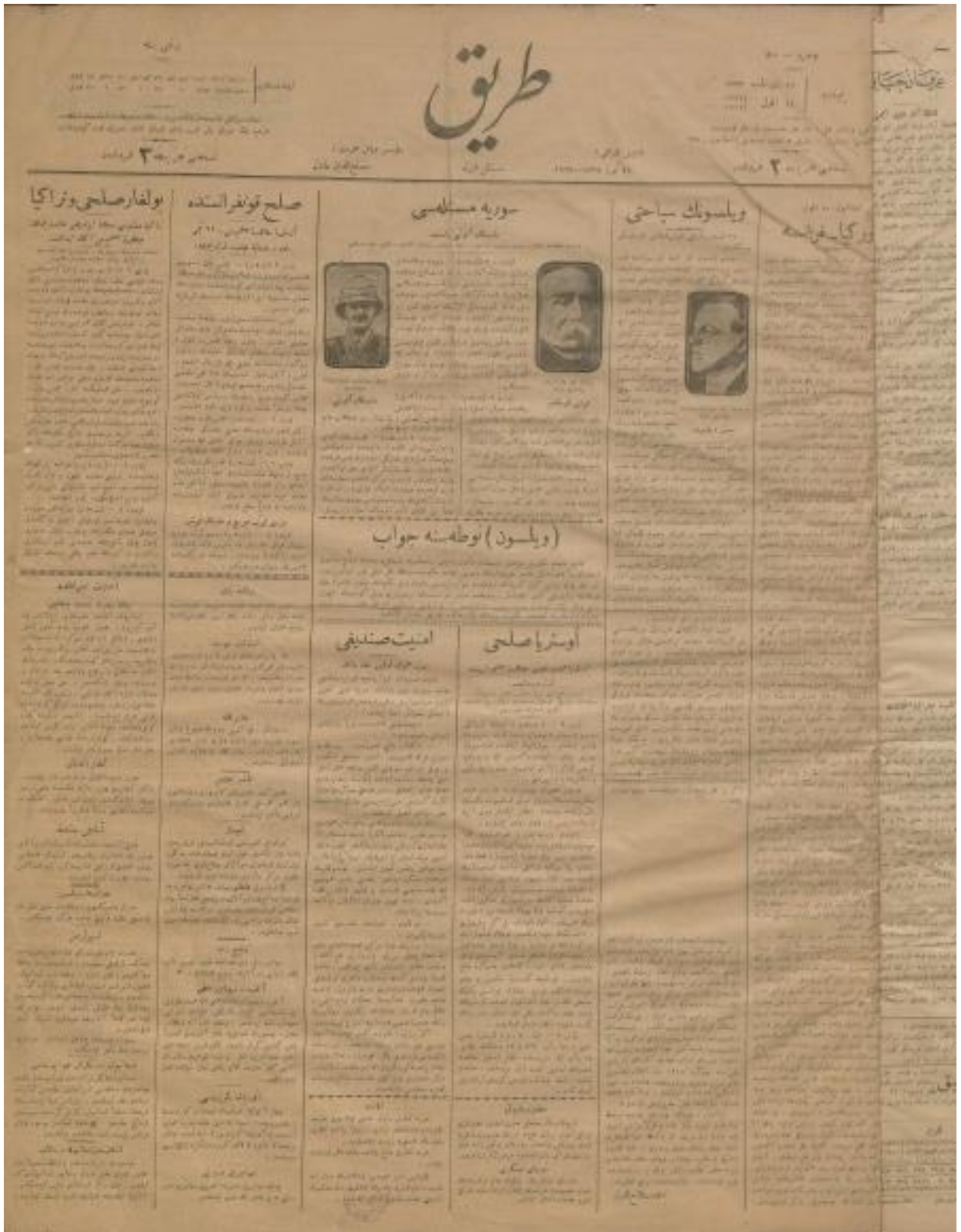
Tarik Gazetesi, "Wilson'un Notasına Cevap", 11 Eylül 1919,s.1.