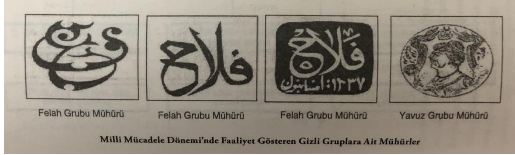
Resim 3: Felâh ve Yavuz Grubu Mühürü: Yurtsever, 2013:226.

Hamza grubu ismiyle toplanan bu istihbârat grubu 15 Aralık 1920’de “Mücahit Grubu” sonrasında “Muharip Grubu”, adıyla faâliyetlerine devam etmiştir. Bu teşkilâtın “Felâh Grubu” adını alması ise Sakarya Meydan Savaşı’na hazırlanıldığı günlerde mühimmat taşıyan bir motorun İngiliz devriyesine yakalanması sonucu alınan tedbirler çerçevesinde gerçekleşmiştir. Bu tarihten sonra yazışmalarında kendini belirtmek için (F) ve (F.G) gibi kodları kullandığı görülür.