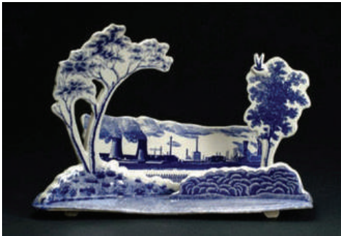
Görsel 2. Paul Scott, "Seascale Güvercini (Seascale Pigeon)", 2003, Sıralı dekal baskı, Porselen.

Sanayileşme ve teknolojik ilerlemeler zaman içinde daha çok enerji ihtiyacını açığa çıkarmıştır. Gelişmiş ülkeler yıllar içerisinde enerji politikalarını ve teknolojilerini değiştirmişler ve üretimi sırasında sera gazı salınımı yapmadığı için temiz, elektrik üretim maliyetli düşük, neredeyse tükenmez olan yenilenebilir bir enerji olarak nükleer santralleri kurmuşlardır. Nükleer santrallerin birçok avantajı olmasına rağmen ne yazık ki nükleer santrallerin sağlık ve çevre için olumsuz olan radyoaktif atıkları çok tehlikelidir. Nükleer santraller aynı zamanda o kadar savunmasız hedeflerdir ki savaş anında ya da terör eylemleri için her an hedefe dönüşebilirler ve tüm canlılığı etkileyecek kadar tehlike oluşturabilirler. Nükleer santrallerde kullanılan yakıt ve atıkların radyoaktif olması, olası kazalar ve doğal afet anında ortaya çıkan radyasyonla doğaya telafisi olmayacak boyutlarda zarar vermektedir. Nükleer santralde oluşan basit bir kazanın etkisiyle havaya salınan radyasyon yavaşça yayılmaya başlar ve asla “ülke sınırlarını tanımaz” (Toros ve Öztürk, 2011) ve sanıldandan çok geniş bir coğrafyaya yayılır.