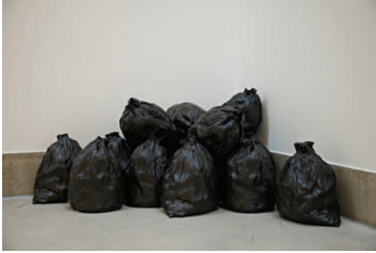
Görsel 16. Maude Schneider, "Çöp (Garbage)", 2011, Stoneware, 160x110x75 cm, yaklaşık 17 çöp torbası, 1 torba yaklaşık 40x38x32 cm.

Plastik atıklarla beraber azalmadan artan ve iklime etki eden bir diğer sorun ise içinde bulunduğumuz tüketim dünyasında hızla artarak biriken çöp yığınlarıdır. Çevresel ve ekonomik konuları günlük yaşamdaki nesnelere mizahi bir yolla anlatan sanatçı Maude Schneider, Çöp (Garbage) adlı çalışmasında "seramik çöp poşetlerinden bir enstalasyon hazırlar. Eserinde "mevcut modelin krizini, olası bir tasarımın yokluğunu, saçma, eksik ve yerinden çıkmış bir gücün sonucunu vurgulamaya çalışmaktadır. Bu çöp poşetleri şimdiki zamanımızın görüntüsü, aşırı modernite ve aşırı tüketimin" (http 11) sonucunda bir nevi insanları kendileriyle karşı karşıya gelme halidir (Görsel 16).