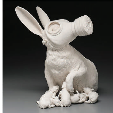
Görsel 1. Kate Macdowell, "İlk ve Son Nefes (First and Last Breath)", 2010, Elle şekillendirme, Porselen, 28x23x30,5 cm.

tarif ettiğimiz, "insanlar tarafından atmosfere salınan gazların sera etkisi yaratması sonucunda dünya yüzeyinde sıcaklığın artması" (http 4) tüm canlılığın ve çevrenin en ciddi sorunu haline gelmiştir. Özellikle "Dünya Savaşları'nın ardından hız kazanan çevre sorunları, Soğuk Savaş Dönemi'nin getirdiği aşırı sanayileşme ve enerji yarışı ile şiddetlenmiştir" (Oruç, 2017, s. 28). Bu hızlı üretim-tüketim artışı ile beraber enerji üretimine hiç duyulmadığı kadar ihtiyaç duyulmuş, fosil yakıtlar olarak bilinen; kömür, petrol ve doğalgazdan elde edilen enerjinin karşılığında doğaya bilinçsiz bir şekilde salınan atık ve gazlar havadaki karbon miktarını artırmıştır.