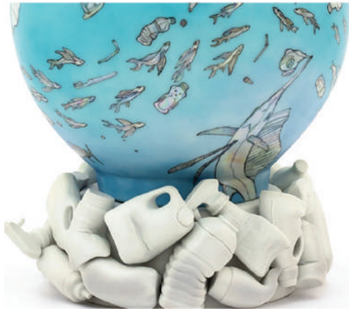
Görsel 14. Bradley Klem, "Denizde Daha Çok Balık Var (There's More Fish in the Sea)", 2020, Elle şekillendirme, Porselen, 38 x 28 x 28 cm.

Galapagos Adaları'na yaptığı bir araştırma gezisi sırasında dünyayı saran plastik kirliliğin en uzak yerlerde bile bulunmasından çok etkilenen sanatçı Brandi Lee Cooper evine giderek bu küresel kirliliği anlatmak için çevrede kalan çöpler, atık bitki materyalleri ve çöp