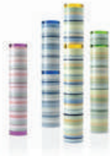
Görsel 7. Julie Bartholomew, “Antropojenik Katmanlar (Anthropogenic Scrolls)”, 2018, Atılmış porselen ve dökme cam - 4’lü set, 90x18 cm, 110x18 cm, 128x18 cm, 100x18cm.

çekirdekleriyle anlatmaktadır. “Buz çekirdekleri, yıllık kar yağışı nedeniyle sürekli artan buz kütlelerine sahip olmalarından kaynaklı fantastik birer arkeolojik kayıt kaynağıdır. Bu da şu anlama gelir; herhangi bir yılda atmosferde neler olduğu bir buz katmanına bakarak anlaşılabilir” (Akçay, 2018). Julie Bartholomew’ın eserindeki renkli sırlarla oluşturduğu yatay çizgilerden oluşan katmanlar binlerce yıl boyunca yeryüzünde meydana gelen antropojenik değişiklikleri ve Avustralya Antarktika Toprakları’ndaki buzullardan çıkarılan, gerçek buz çekirdeklerinden toplanan bilimsel verileri tanımlar. Cam ve seramiğin yarı saydam nitelikleri, Antarktika’nın buzulları ve buz yatakları içinde gizlenmiş iklim değişikliğinin görünür kanıtlarını ortaya koymaktadır (Bartholomew, 2018) (Görsel 7).