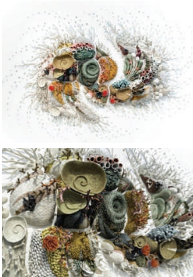
Görsel 9. Courtney Matisson, “Değişen Denizlerimiz IV (Our Changing Seas IV)”, 2019, Elle şekillendirme, Sırlı porselen, 335x518x55 cm.

Giderek artan hava kirliliği, sera gazlarının etkisiyle ısınan okyanus suları, fosil yakıtların kullanımı, aşırı avlanma, plastik atıkların gün geçtikçe artması gibi etkenler sonucunda dünyanın yaşam döngüsünün en büyük kısmını oluşturan mercanlar yok olmayla karşı karşıya gelmektedirler. Deniz sularının ısınması ve asit oranlarındaki değişimlerden dolayı; mercanlar o güzelim renklerini kaybeder, beyaz- gri bir renk alarak canlılıkları yitirip ölürlür. “Mercan resiflerinin tahrip olması birçok deniz canlısının da artık yok olması ve karbon döngüsünün de bozulması demektir” (Şeker, 2011, s. 35). Dünya oksijeninin %70’ini karşılayan alglerin yok olmasıyla birlikte tüm ekosistem çökme tehlikesi altına girmiştir.