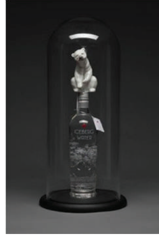
Görsel 8. Penny Byrne, “Buzdağı Suyu (Iceberg Water)”, 2017, Hazır malzeme, Şişelenmiş iceberk suyu, Porselen kutup ayısı, Swarovski gözyaşı kristali, Epoksi reçine, 53x34x34 cm.

CO 2 depolama kapasitesini artırmaktadır” (Demir, 2009, s. 44). Buzullardaki erimenin devam etmesi nedeniyle bu habitatta bulunan türlerin yok oluşu ve iklim değişikliği felaketinin önüne geçilebilmesi ne yazık ki mümkün gözükmemektedir.