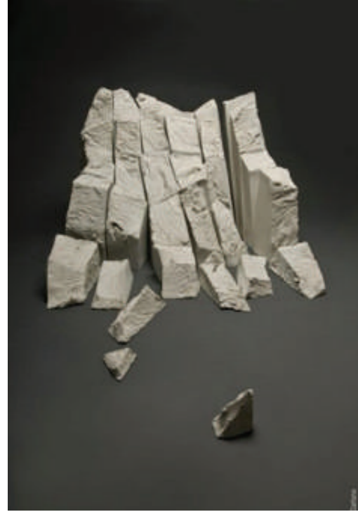
Görsel 6. Paula Winokur, "Parçalanmış Buzul (Calving Glacier)", 2010, 33 adet porselen kesit, Elle şekillendirme, 15x20x91 cm.

göremeyecekleri buzulları anıtlandırmak istemiştir (Görsel 6).