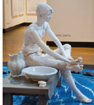
Görsel 10. Nan Smith, "Cıva (Mercury)", 2014, Çoklu ortam, Sırlı seramik, Kumaş, Ahşap ve metal üzerine fotoğraf montajları, 427x310x607 cm.

uzaklaştırılması için bir metaforudur. Ön plandaki görüntüler, kirli sulardan kaçtıktan sonra kendini temizlemeye çalışan düşünceleri yansıtmaktadır. Sanatçı cıvayı okyanus içinde hareket eden bir araç olarak hayal etmiştir. Bu zehir, balıklar arasında sonsuz bir hareketle gezinmekte ve konserve ton balığı olarak insan bedenine girmektedir (Görsel 10).