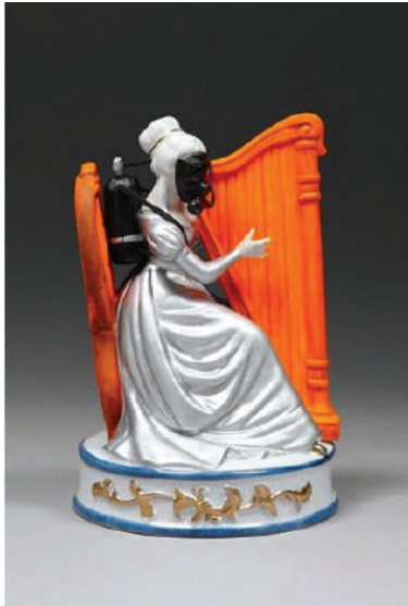
Görsel 4. Penny Byrne, “Fukuşima Senfoni (Fukushima Symphony)”, 2011, Hazır malzeme, Eski porselen heykelciği, Action man aksesuarları, Epoksi reçine, Toz boya, 18x13x12cm.

hizmet vermiş 200,000 acil servis çalışanı arasından radyasyona bağlı kanser ve lösemiden 3,940 ölüm, 116,000 tahliye sürüklenmiş vatandaş ve en kirlenmiş alanda yaşayan 270,000 şehir sakini dahil toplamda yaklaşık 600,000” (http 7) kadar kişi hayatını kaybetmiştir. Bugün hala patlamanın etkileri birçok insan ve canlı yaşam üzerinde sürmektedir. Britanya'nın en tanınmış çağdaş sanatçıları arasında yer alan Grayson Perry çalışmalarında “şiddet, önyargılar, cinselliğin bastırılması ve insanların bel bağladığı alışlagelik davranış kalıpları ve inanışlar gibi ciddi konuları, yanlış anlaşılma kaygısı gütmekten” (http 8) işlemektedir. Altın Hayalet (Golden Ghost) adlı seramik eserinde Çernobil Nükleer Santrali'ndeki felaketi konu almış; vazosunu geleneksel elle şekillendirme yöntemi ile biçimlendirilmiştir. Vazonun yüzeyini tuval gibi kullanarak resimsel bir tavırla felaketten etkilenen çocukların mutsuz ve üzücü yüz ifadelerini sır üstü tekniği ile dekorlayarak anlatmış, felakette yaşamını yitiren çocuklarına ruhlarını altın dekorla onurlandırmıştır. Hayatını kaybeden 600.000 kişi için vazonun yüzeyine binlerce tabut işlemiştir (Görsel 3).