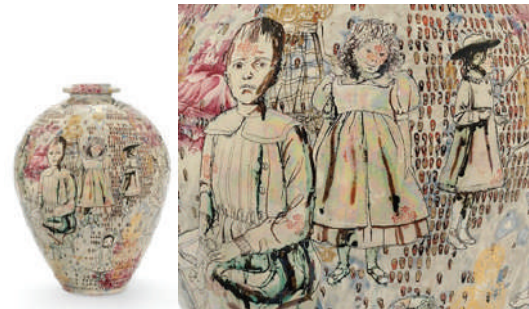
Görsel 3. Grayson Perry, "Altın Hayalet (Golden Ghosts)", 2000, Sırlı seramik, 65x39x39 cm.

10 Ekim 1957 yılında İngiltere'nin en kötü nükleer olaylarından biri olarak tarihe geçen, Cumbria kıyısındaki Seascale'ye yakın, çok işlevli Windscale Nükleer Santrali'ndeki yangın nedeniyle havaya yayılan radyoaktif madde; tüm canlı yaşama ve ekosisteme çok ciddi zararlar vermiştir. "Nükleer silah tasarımlarına el atmaya hevesli olan İngiliz liderler, kazanın gerçek nedenini örtbas etmiş ve kazadan Windscale'in kahraman işçilerini sorumlu tutmuştur" (http 5). Çevreye yayılan radyoaktif maddelerle "100 ila 240'ı ölümcül olmak üzere uzun vadede yaklaşık 240 kadar kişinin kansere yakalandığı tahmin edilen" (http 6) bu nükleer kazayı, İngiltere doğumlu politik ve çevresel sorunları, antika tabaklara yaptığı manipülasyonlarla anlatan sanatçı Paul Scott unutturmaz. Scott, Seascale Güvercini (Seascale Pigeon) adlı eserinde, seramikten üç boyutlu mavi beyaz dekorlu ağaçların arkasına Windscale Nükleer Santralinden doğaya salınan zehirli gazları bir manzara resmi gibi sunmuş ve havaya dağılan radyoaktif maddelerden dolayı Seascale kasabasında artık bir güvercinin bile özgür uçamayacağı vurgulamak istemiştir (Görsel 2).